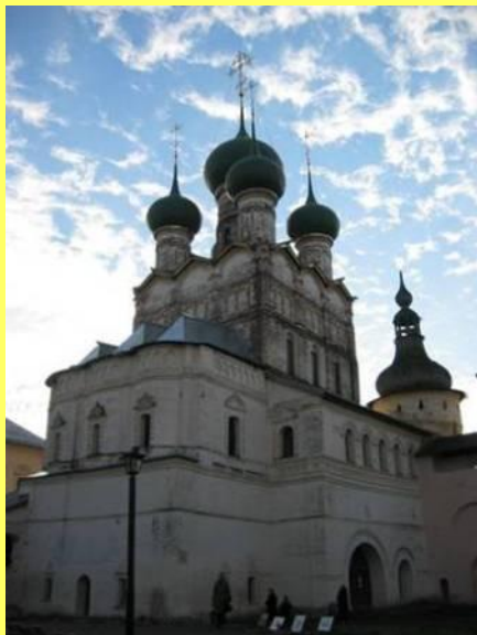
Надвратная церковь Иоанна Богослова