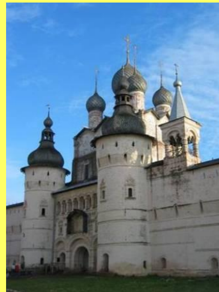
Надвратная церковь Воскресения