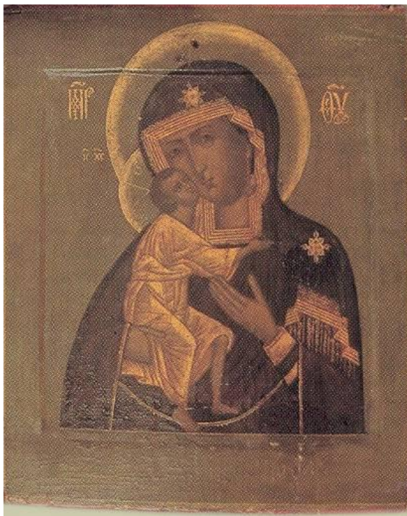
Чудотворная Феодоровская икона Божией Матери