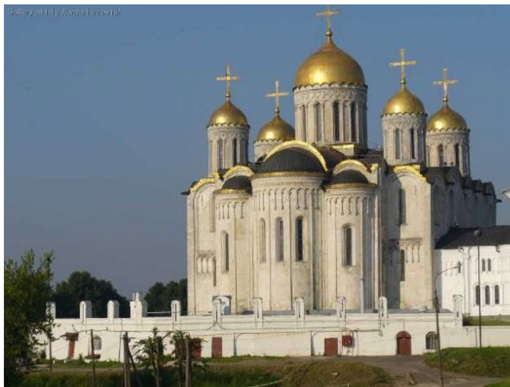
Владимир. Успенский собор.12 век

В городах строятся красивые храмы. Город является центром религиозной жизни Древней Руси.