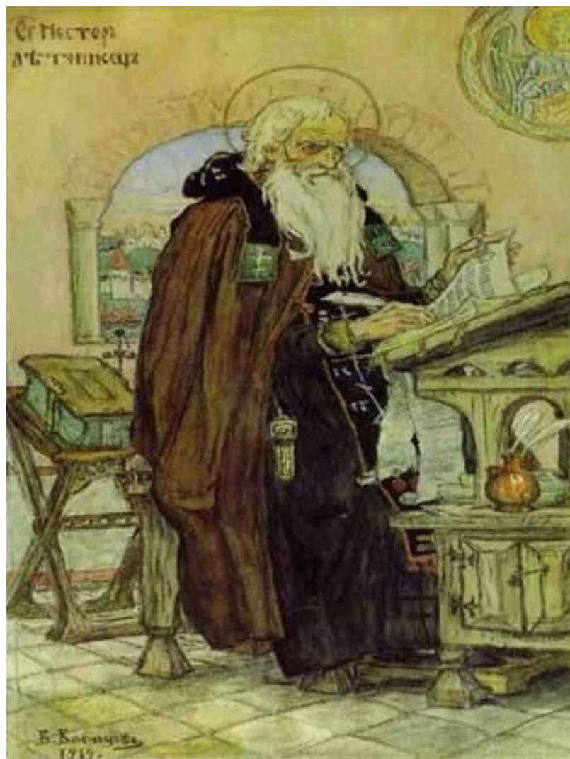
Нестор – монах Киево-Печёрского монастыря, знаменитый летописец