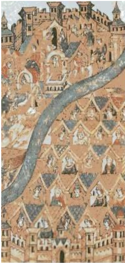
Город. Летописная миниатюра.

Иностранные купцы обширное пространство вдоль важного торгового пути «из варяг в греки» называли «Гардарики» - «страна городов».