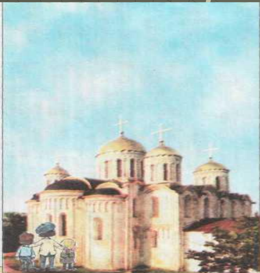
Успенский собор во Владимире.