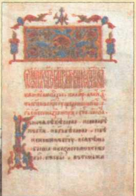
Кириллический алфавит (фрагмент).

Ѧ зъ Ѧ бѣки б вѣди в глаголь г добро д ѣсть е живѣте ж сѣло з земля з ѡже н како к люди л мыслѣте м нашъ н онъ о покой п рцы р слово с твердо т ѡкъ ѡ фертъ ф хѣръ х отъ ѡ цы ц червь ч ша ш ша щ ѣръ ъ ѣры ы ѣрь ь ѡтъ ѣ ѡсъ ж кси ѡ пси ѡ днѣ д ѡжица ѡ