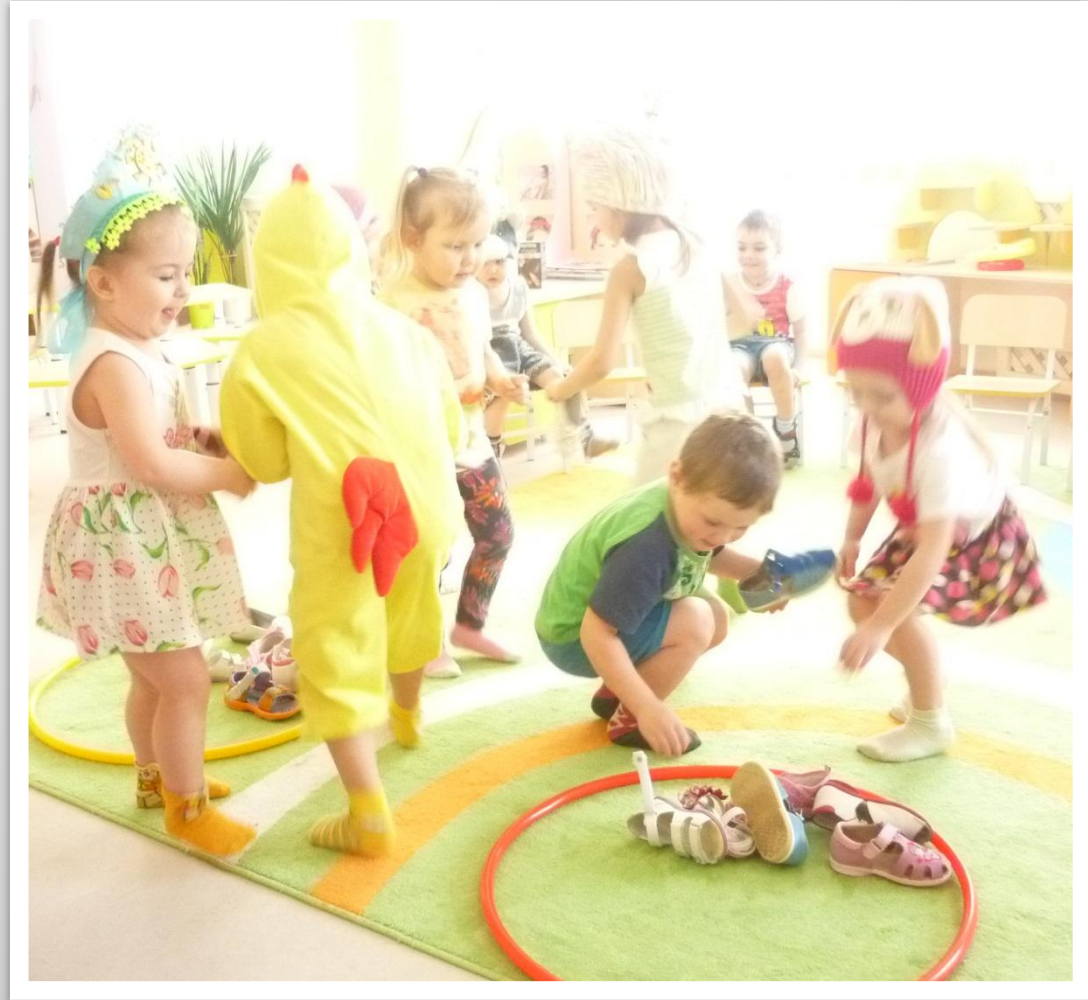
Конкурс «Найди туфельку»