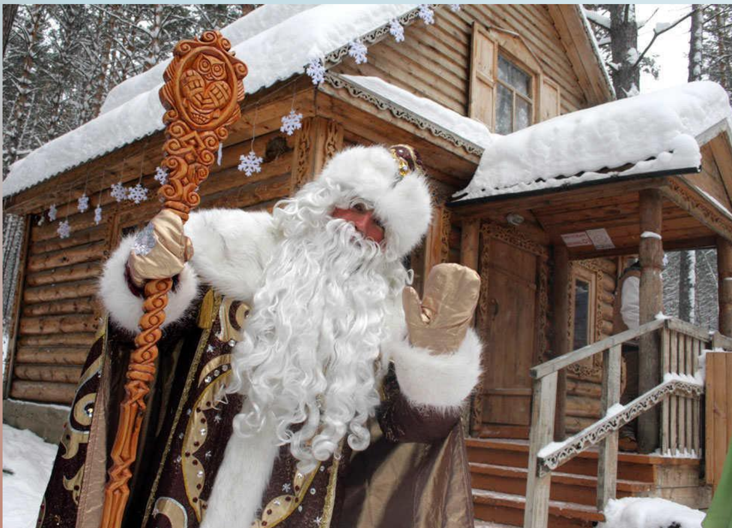
РЕЗИДЕНЦИЯ СИБИРСКОГО ДЕДА МОРОЗА