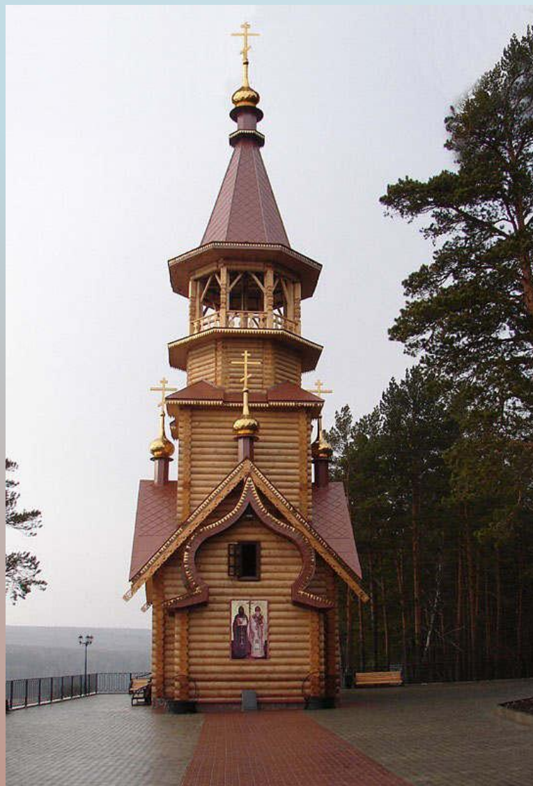
ЧАСОВНЯ СВЯТЫХ РАВНОАПОСТОЛЬНЫХ КИРИЛЛА И МЕФОДИЯ