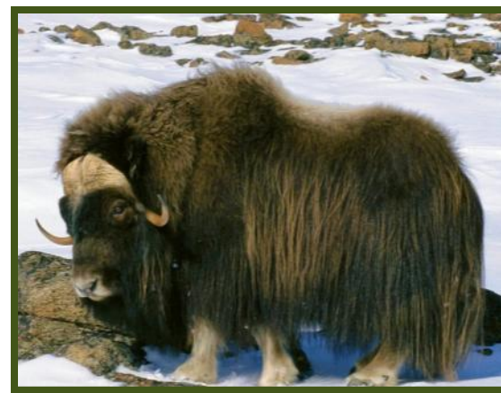
Это як. Кого ты видел? Яка.