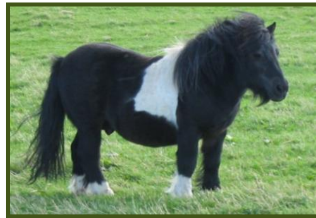
Это пони. Кого ты видел? Пони.