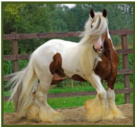
Это конь. Кого ты видел? Коня.

Взрослый называет животных и сообщает ребёнку, что эти животные живут в зоопарке. Затем просит ответить на вопрос: «Кого ты видел в зоопарке?»