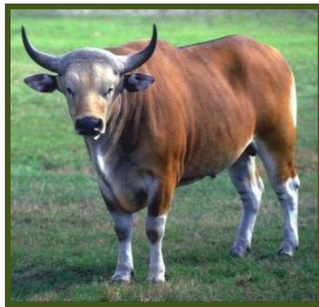
Это бык. Кого ты видел? Быка.