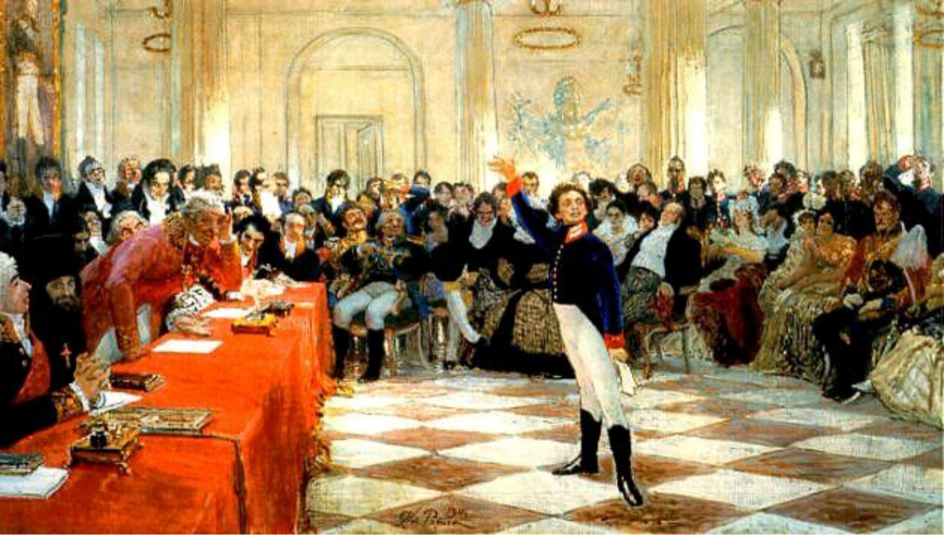
И. Е. Репин. «Александр Сергеевич Пушкин читает свою поэму».