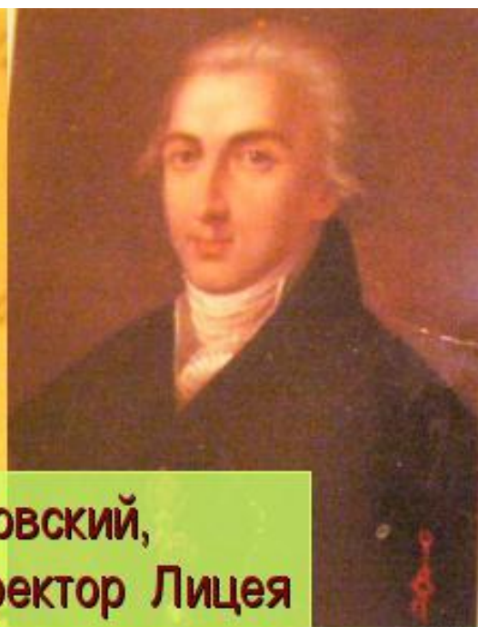
В.Ф. Малиновский, первый директор Лицея