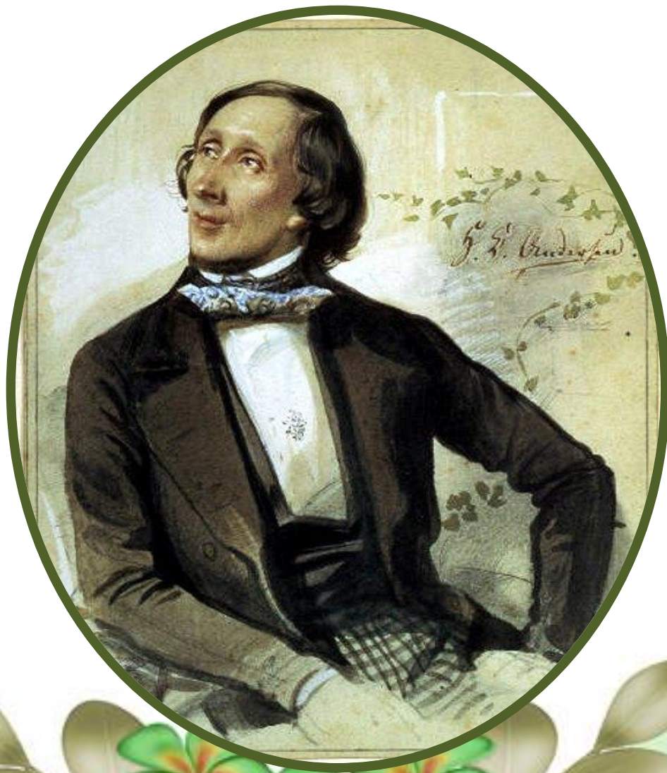
Ханс Христиан Андерсен (1805 – 1875)