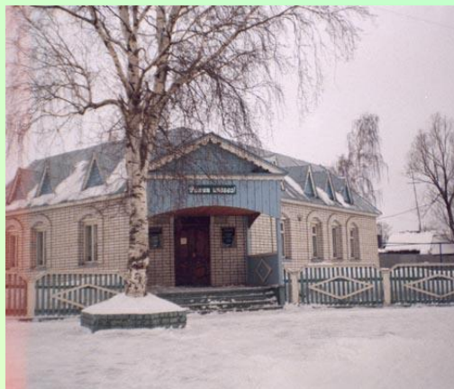
Музей Галии Кайбицкой