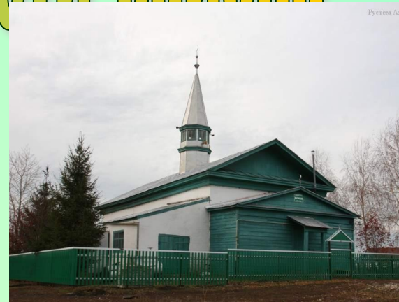
Вид старой мечети села Бурундуки