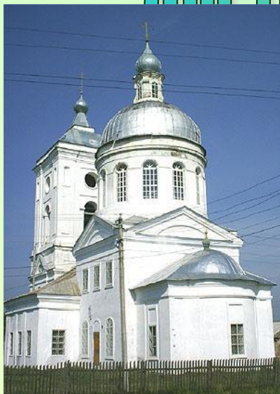
Храм Пресвятой Троицы в селе Турминское