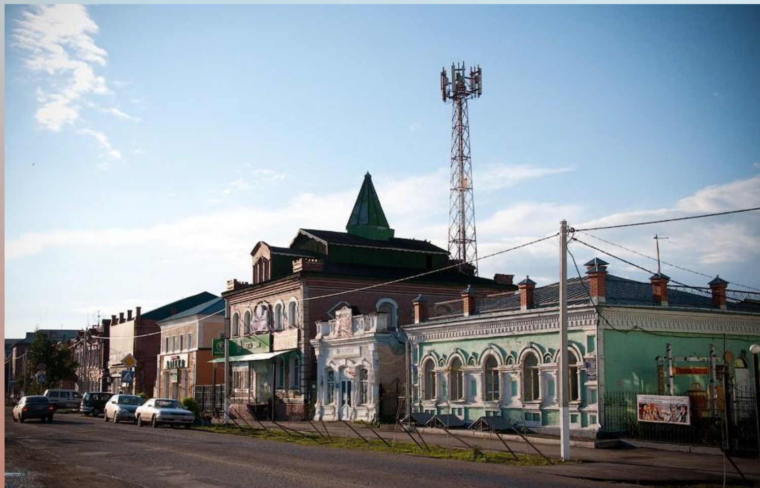
ГЛАВНАЯ ИСТОРИЧЕСКАЯ УЛИЦА ГОРОДА