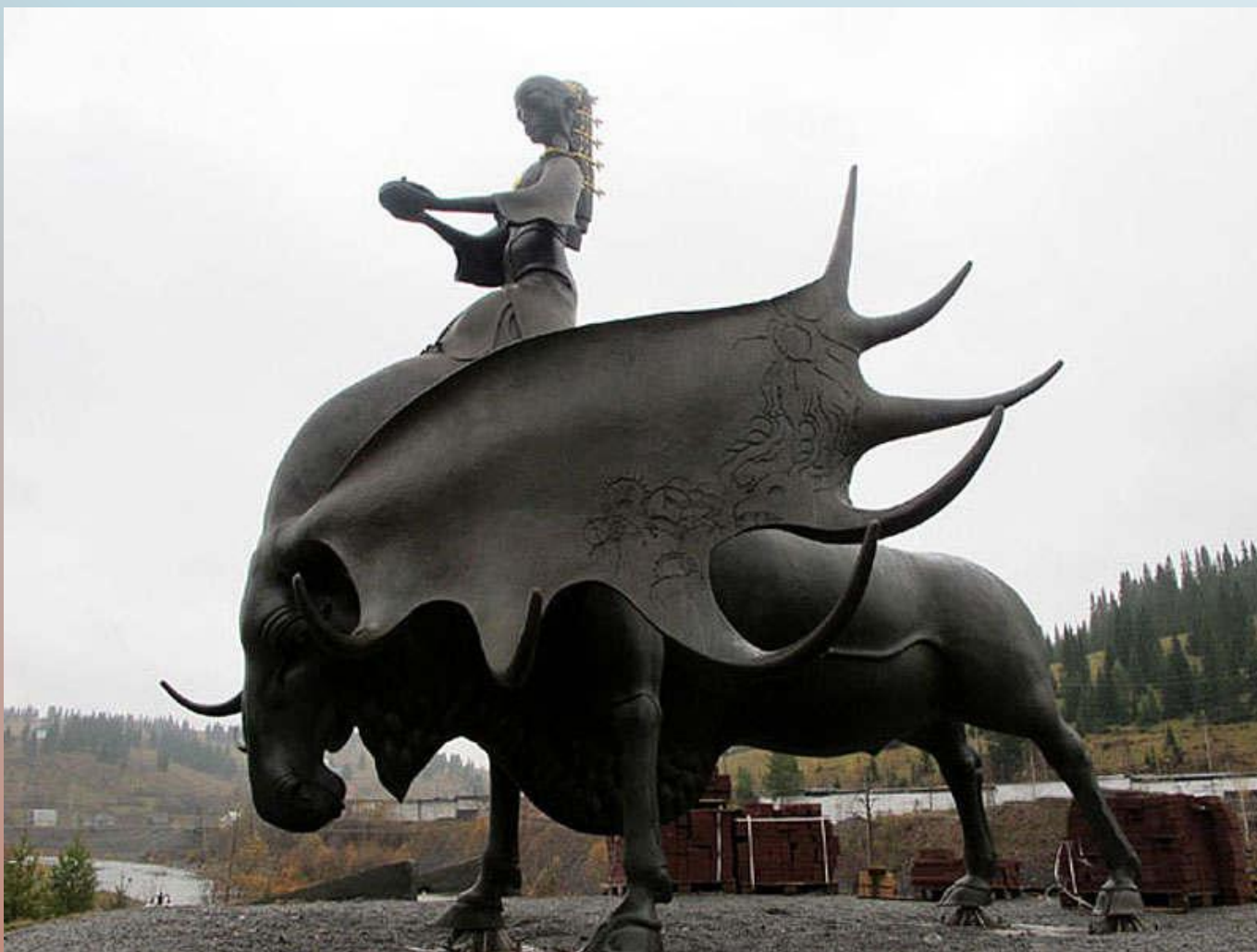
5. СКУЛЬПТУРА «ЗОЛОТАЯ ШОРИЯ» (Г.ТАШТАГОЛ)