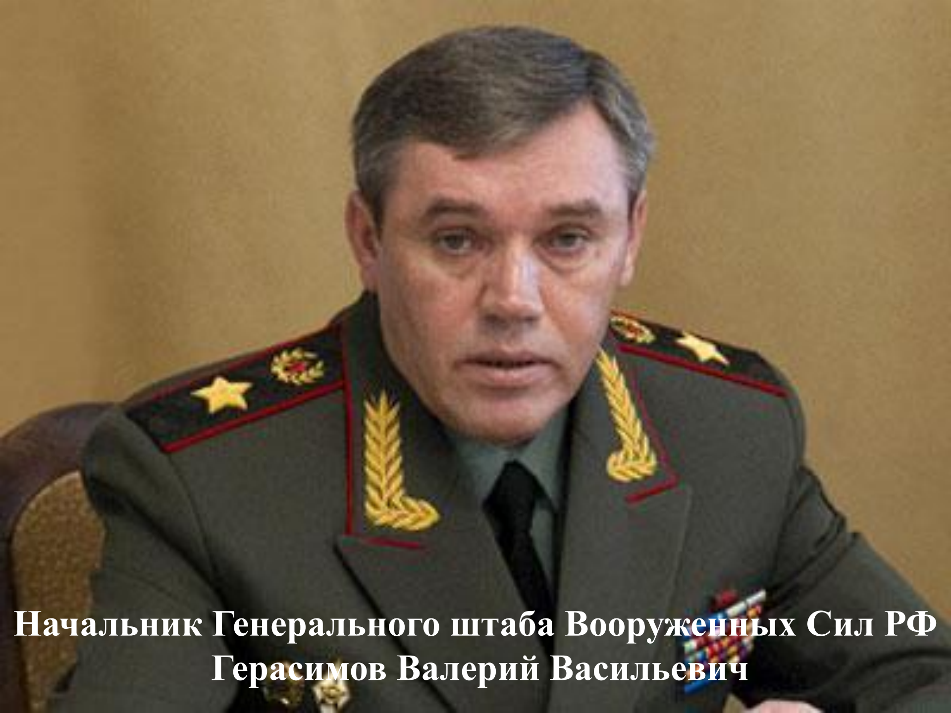
Начальник Генерального штаба Вооруженных Сил РФ Герасимов Валерий Васильевич