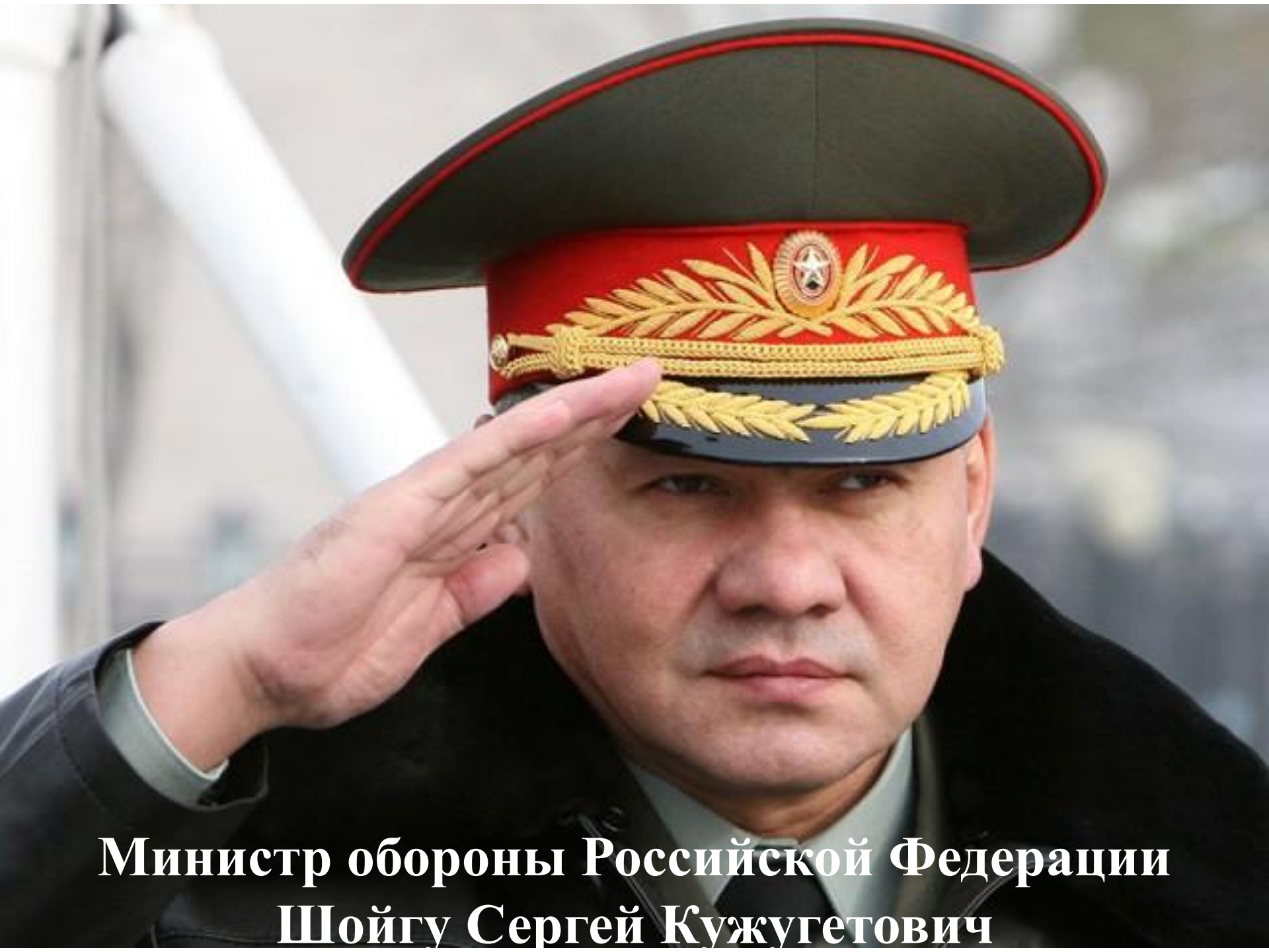
Министр обороны Российской Федерации Шойгу Сергей Кужугетович