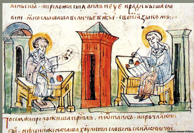
Тосемжипреложившасрпль. и ѿтмань. и пръчлкъмъ. гбѣ. и тѣцннѣиачаша хѹлвити словеса снѣиисрннѣи. Православная Кубань.

Пользуясь новой азбукой, Кирилл и Мефодий перевели на славянский язык ряд богослужебных книг.