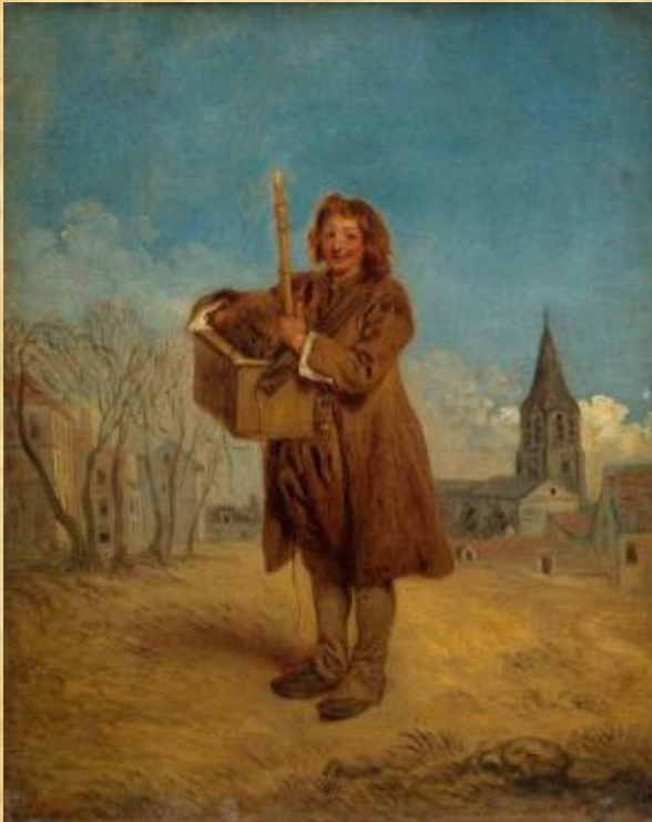
Антуан Ватто «Савояр с сурком»