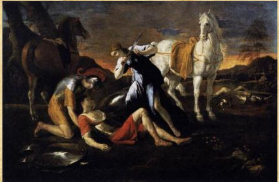
Никола Пуссен «Танкред и Эрминия»