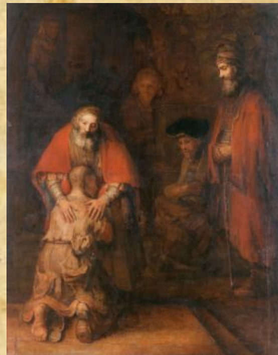
Рембрандт «Возвращение блудного сына»