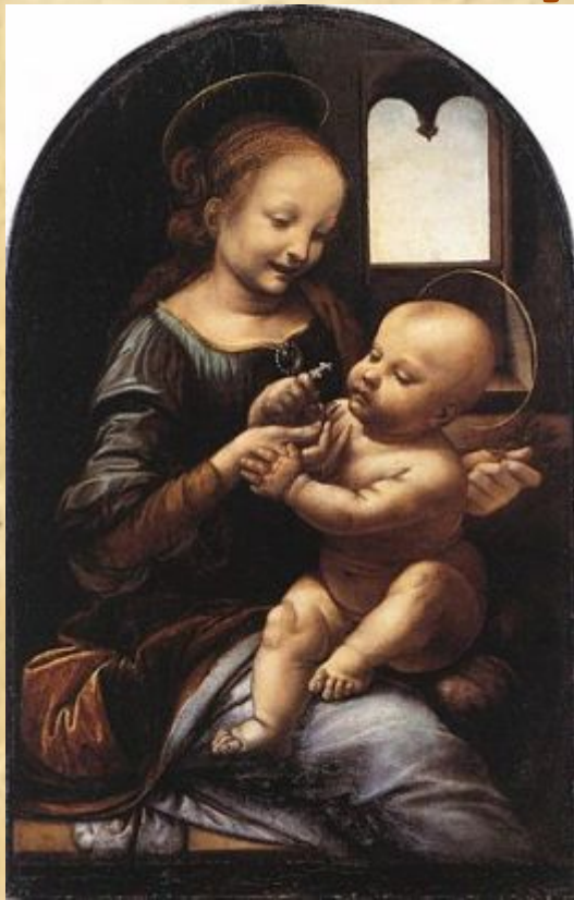
Леонардо да Винчи «Мадонна Бенуа» 1478—1480