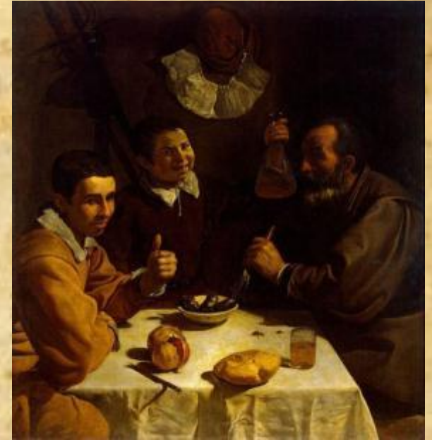
Диего Веласкес «Завтрак»