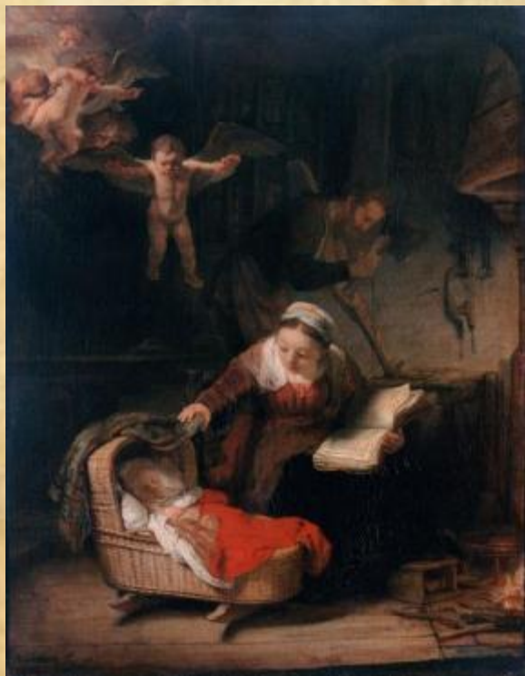
Рембрандт «Святое семейство»