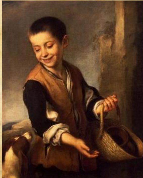
Бартоломе Эстебан Мурильо «Мальчик с собакой»