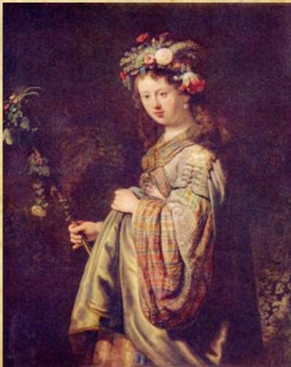
Рембрандт «Саския в образе Флоры»