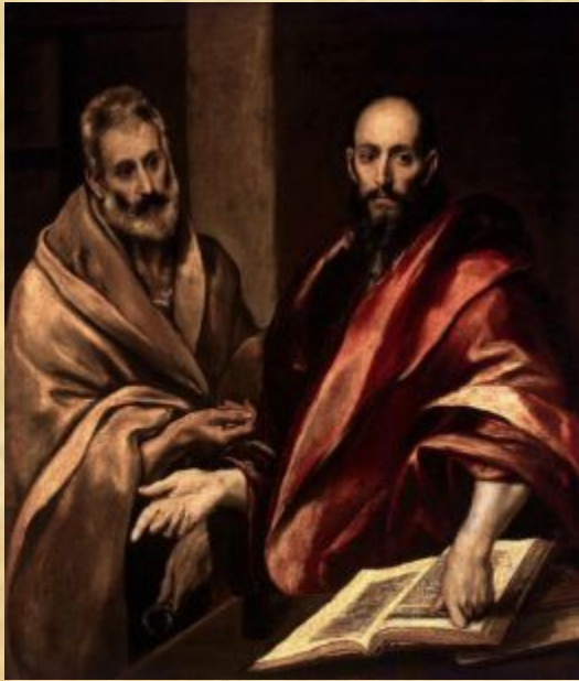
Эль Греко «Апостолы Пётр и Павел»