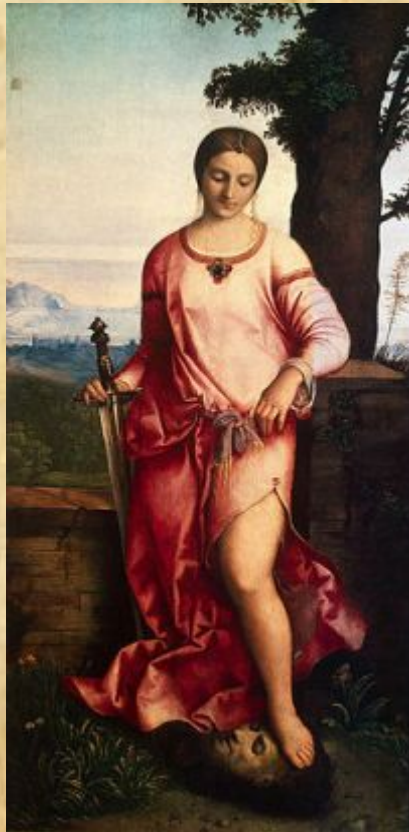
Джорджоне «Юдифь» ок. 1504