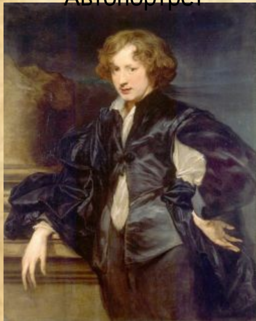
Антонис Ван Дейк Автопортрет