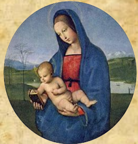
Рафаэль Санти «Мадонна Конестабиле» 1502—04