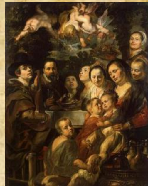
Якоб Йорданс Автопортрет с родителями, братьями и сестрами