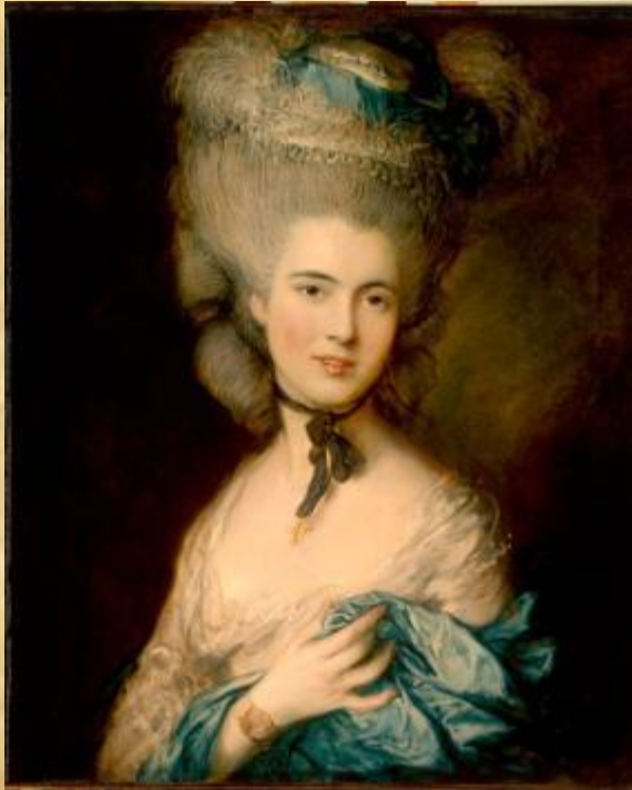
Томас Гейнсборо «Портрет дамы в голубом»