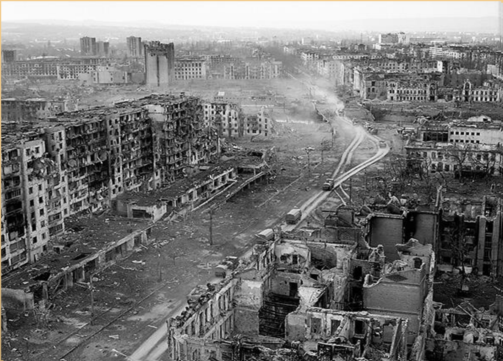
Разрушенный город Грозный.