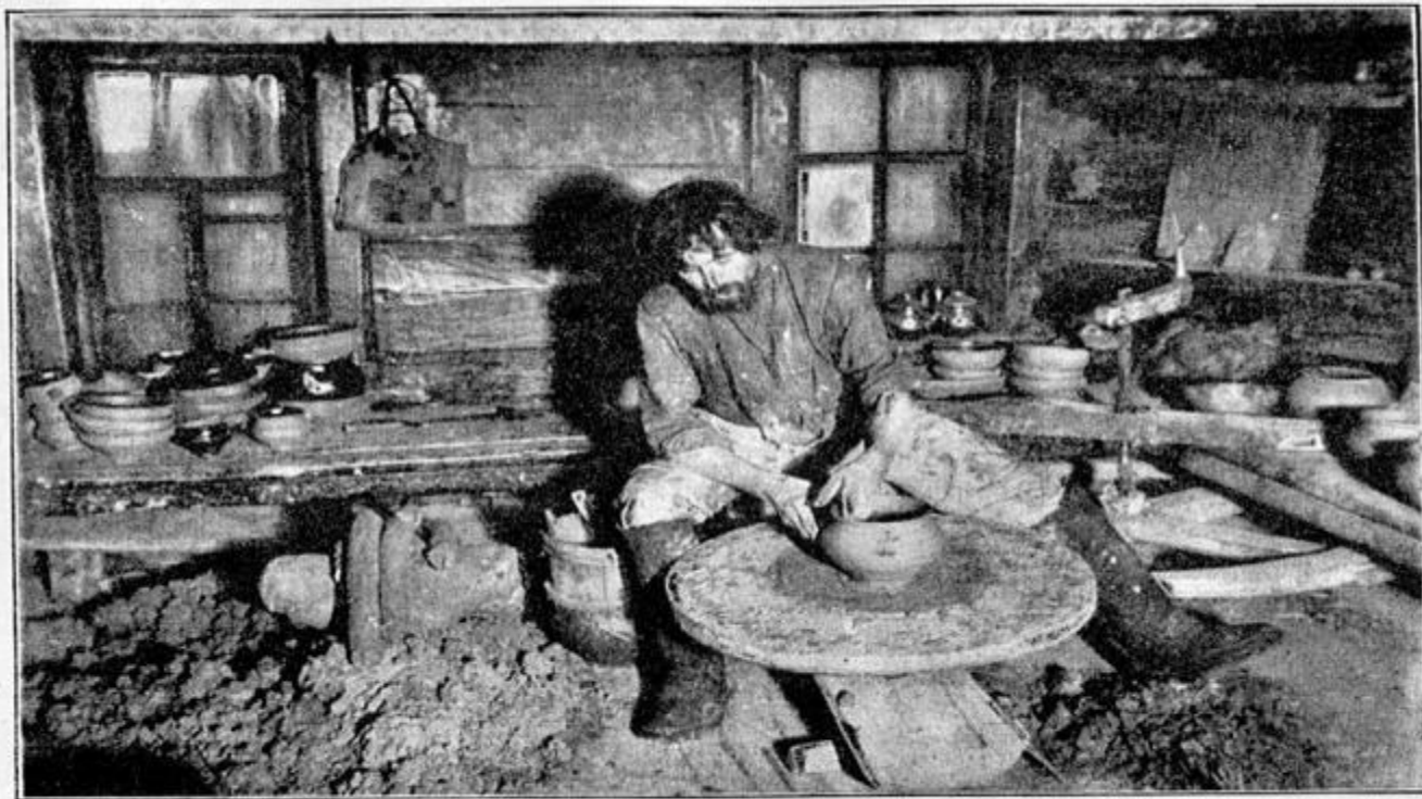
Работа на гончарномъ кругу.

* Как известно, Нижегородская губерния была самой развитой в кустарно-промышленном отношении