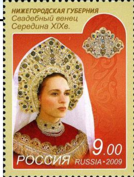
Почтовая марка России, 2009 год