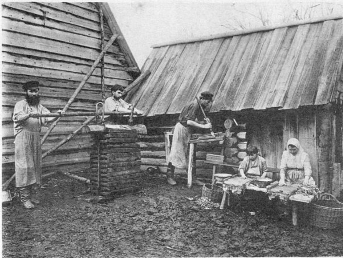
Кожевенное производство («подбор- щики»).