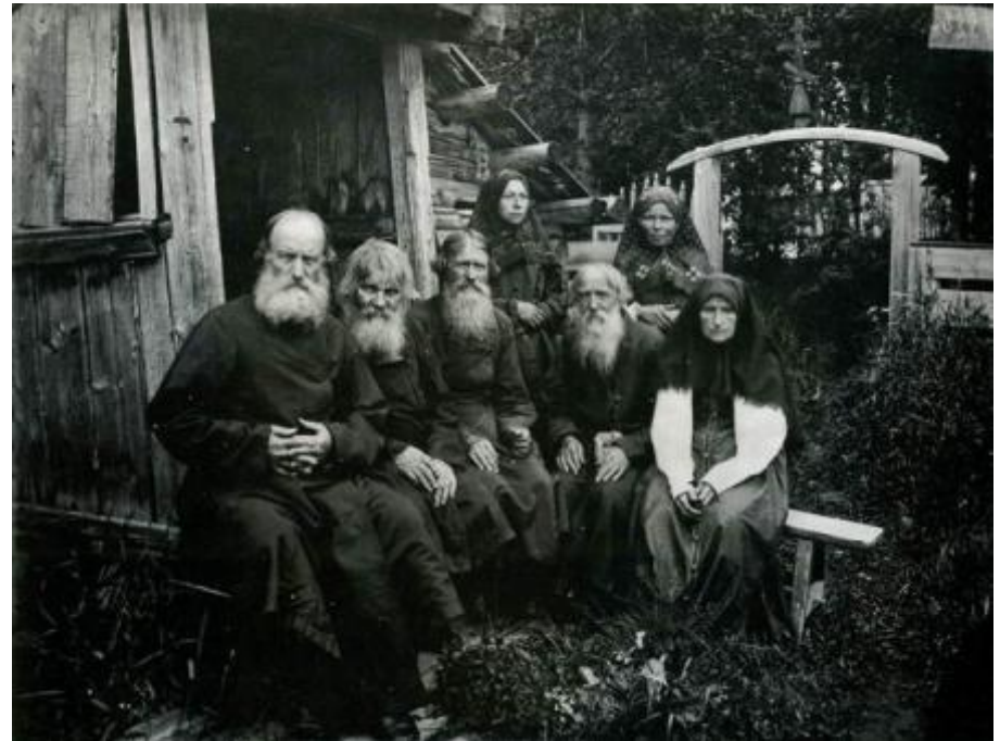
Староверы в Шарпанском скиту (фотография 1897 года)