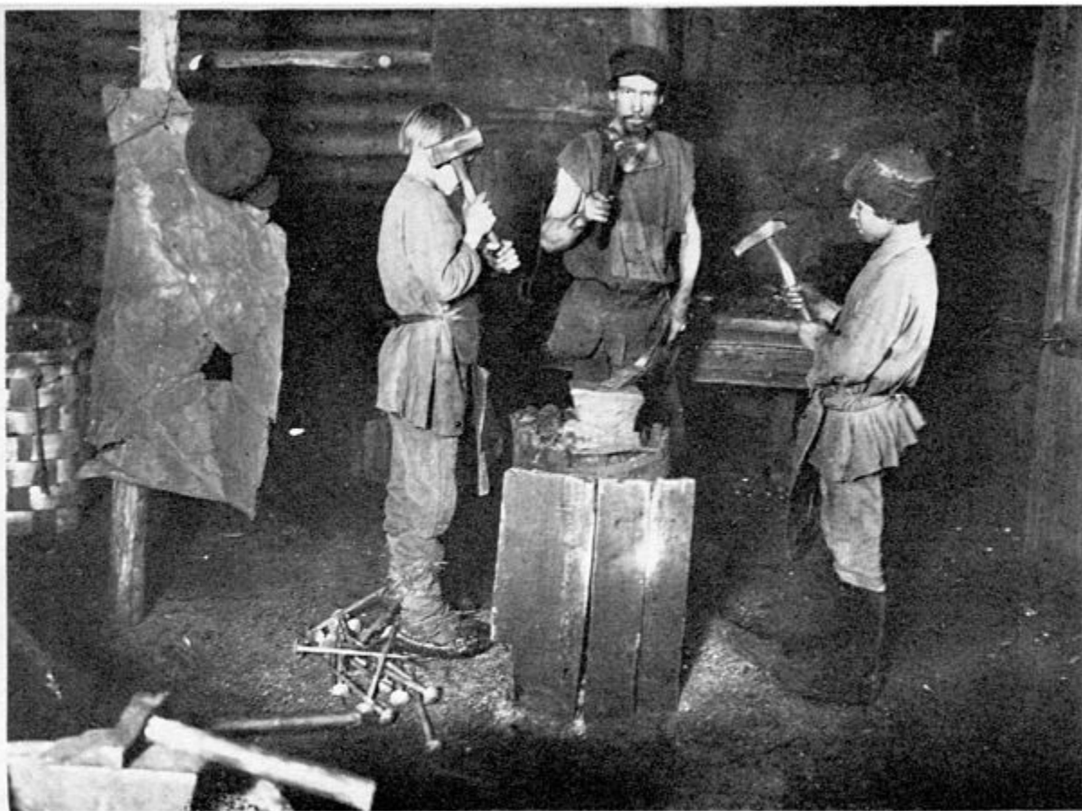
Ковка гвоздей изъ стараго кровельнаго желѣза. Forgeage de clous en vieux fer de toit.