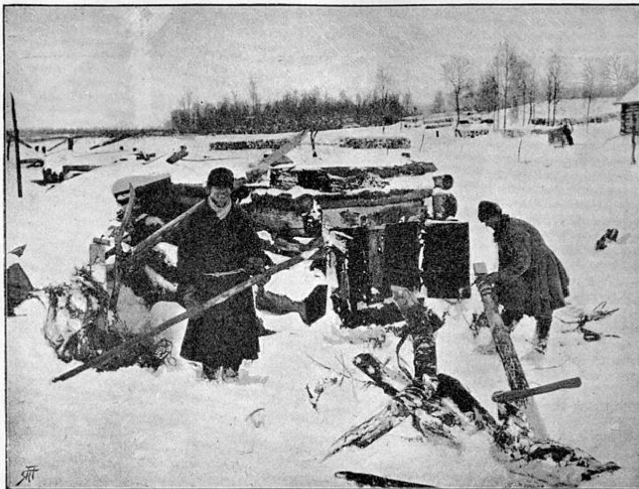
Производство санных полозьевъ.