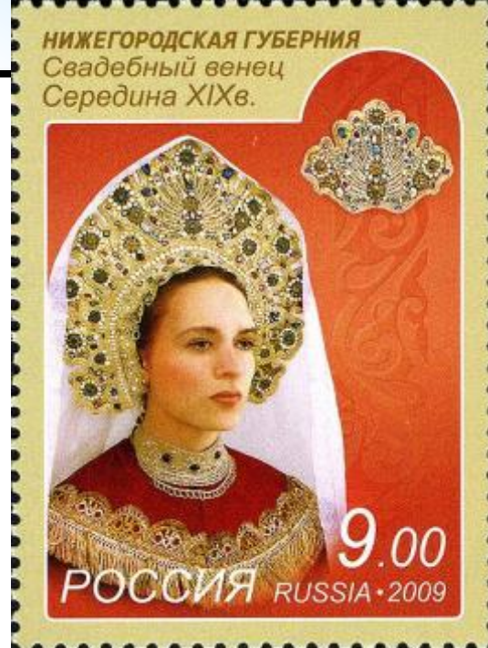
Почтовая марка России, 2009 год