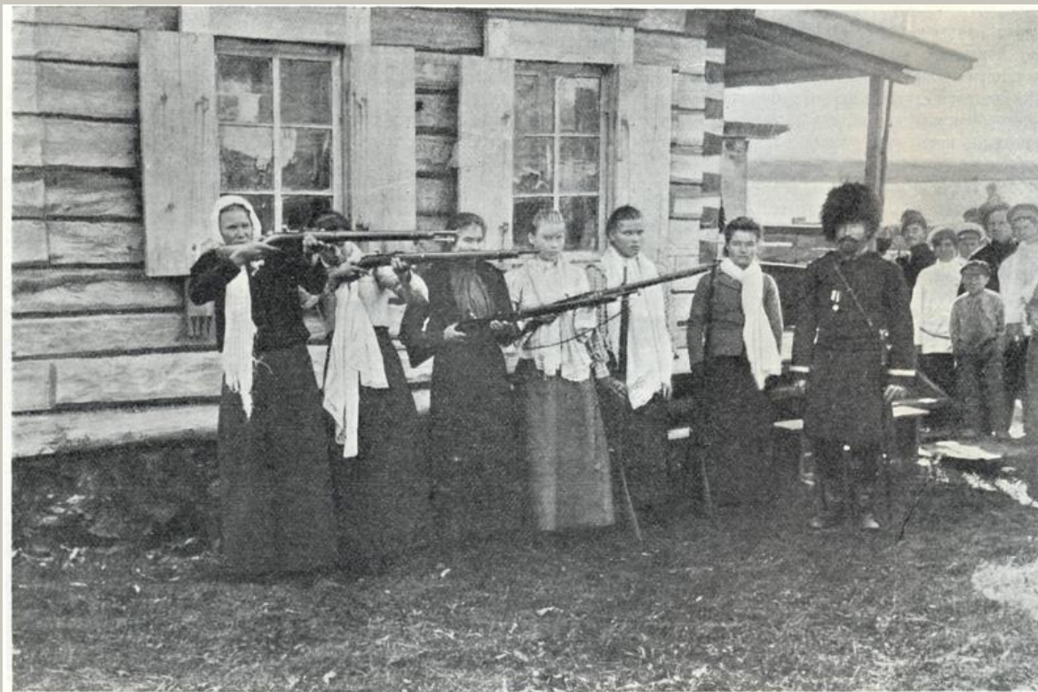
Казачки поселка Васильевского (Примурской области), обученная стрельбе для защиты поселка.

Но казачки не испугались врагов-турок. Они решили защищать свою станицу. Женщины взяли в руки все, что могли: вилы, кинжалы, пики, топоры... Обливали турок кипятком.