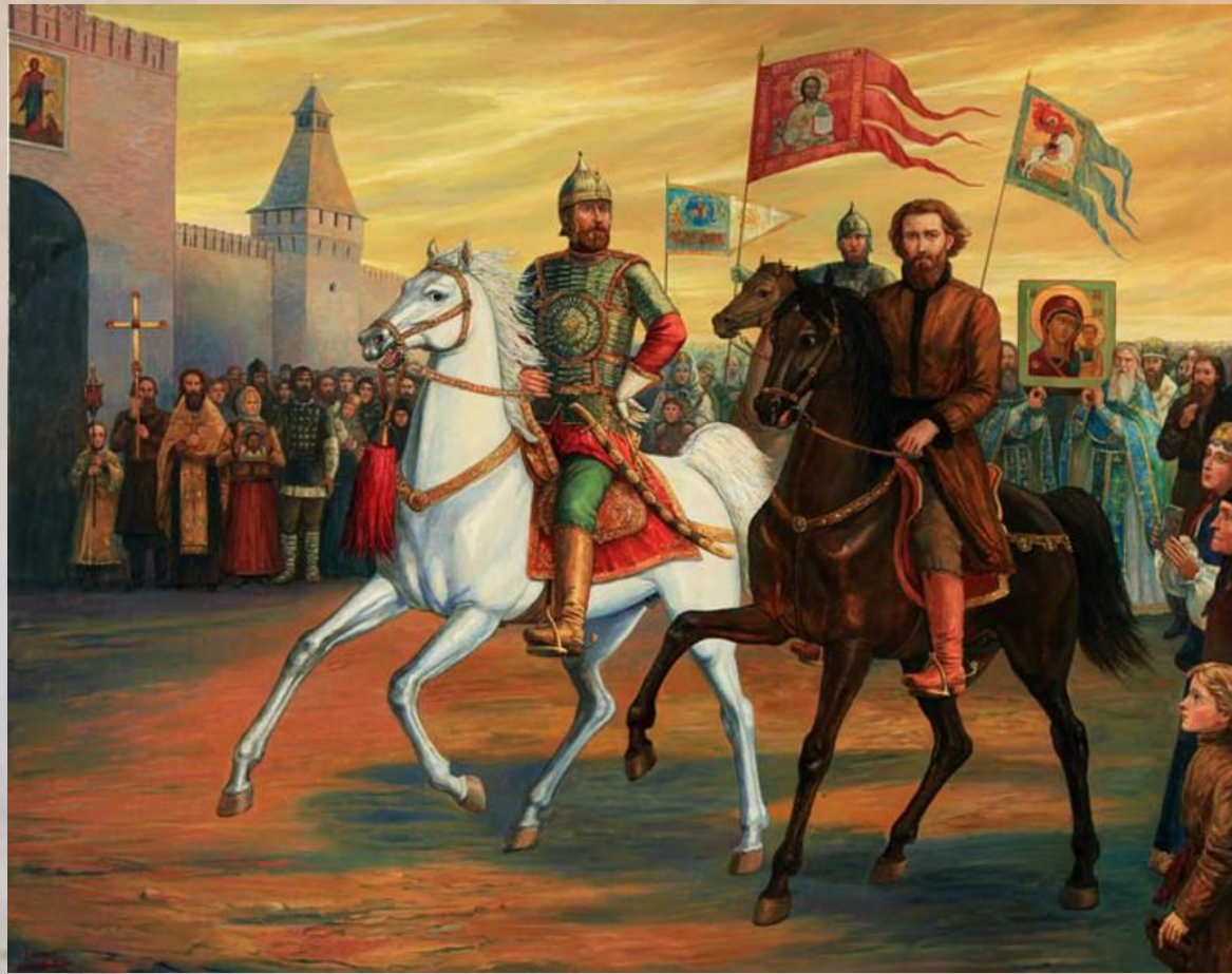
Вступление Минина и Пожарского в Кремль