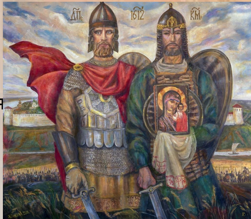
Кузьма Минин и Дмитрий Пожарский

Кузьмы Минина и Дмитрия Пожарского штурмом взяли Китай-город. Князь Пожарский вступил в Китай-город с Казанской иконой Божией Матери.