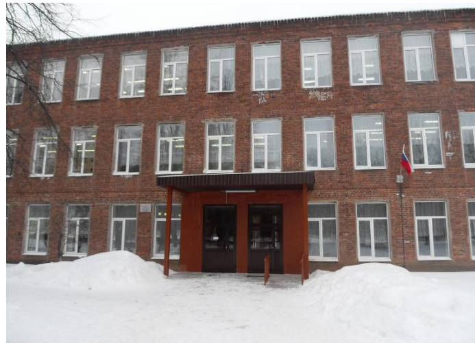
МБОУ КОМСОМОВСКАЯ СОШ №1