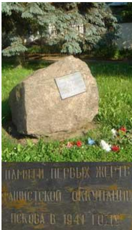
Памяти первых жертв фашистской оккупации Пскова в 1941 году

Жертвы фашистского режима 1941-1944 г. были велики: