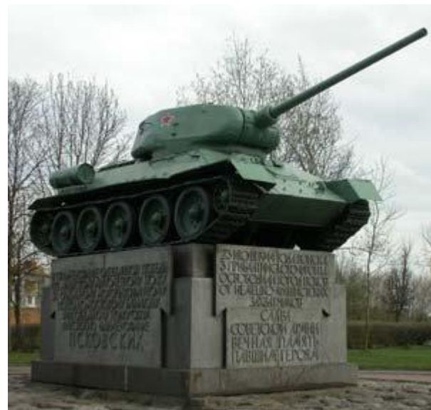
Памятник освободителям Пскова