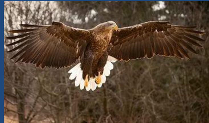
Орлан - белохво