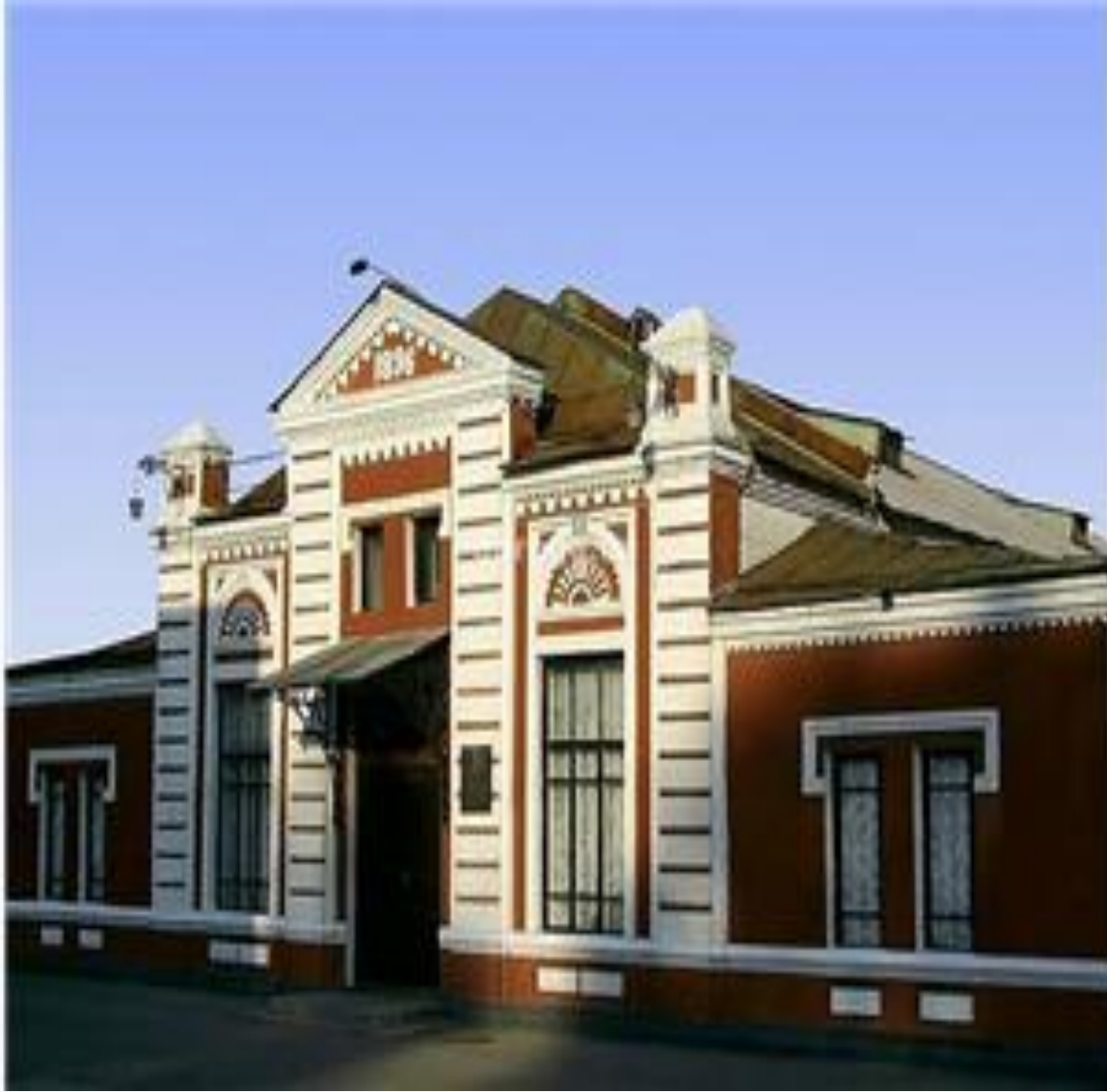
Графский театр Памятник архитектуры 1896 г.