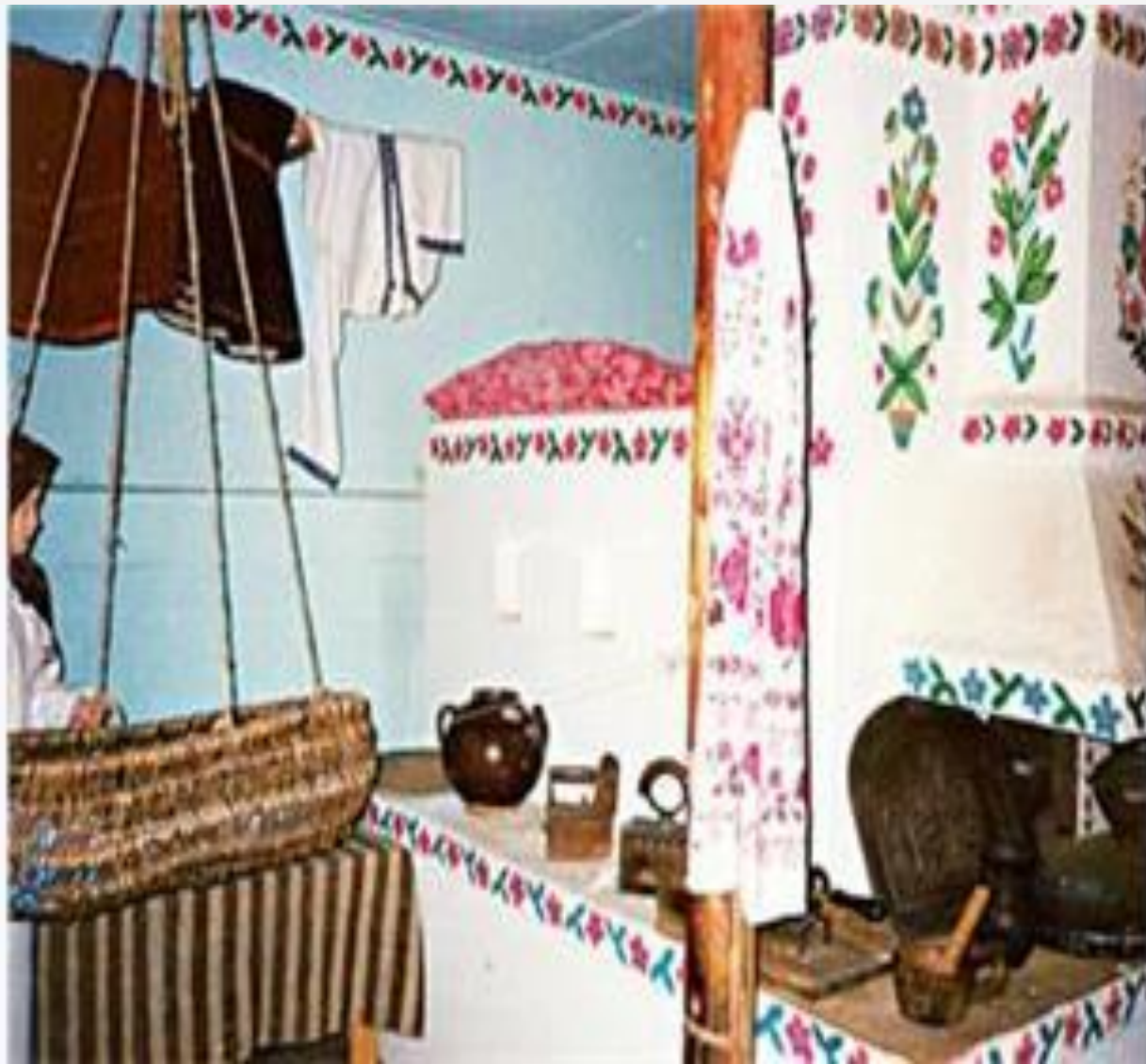
Краеведческий музей 1962 г.