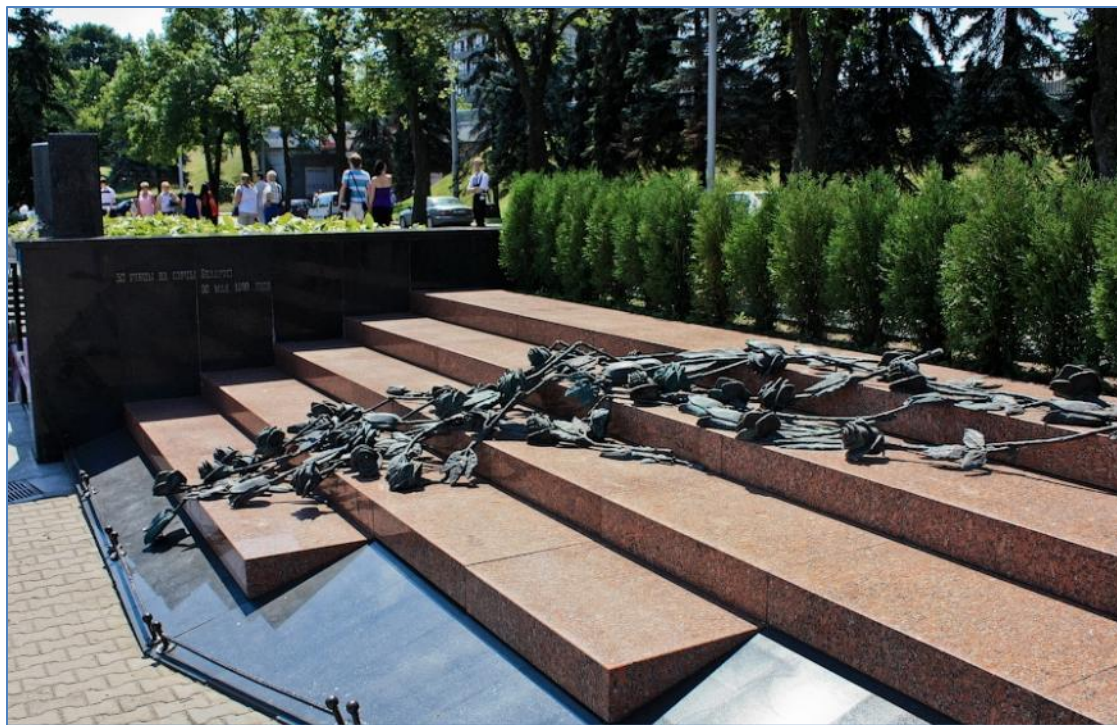
Мемориал погибшим 30 мая 1999г. у входа на станцию "Немига"

В результате внезапно образовавшейся давки у входа на станцию метро «Немига» погибло 53 человека. Буквально за несколько часов до трагедии вокруг станции метро веселились люди, которые пришли на праздник пива. В самый разгар праздника начался ливень с грозой и градом, который заставил всех людей, присутствовавших на мероприятии, броситься в поисках укрытия от ненастья в ближайшую станцию метро. Когда толпа из более чем двух с половиной тысяч человек плотным потоком хлынула с обоих входов в подземный переход, образовалась жуткая давка. Те несчастные, которые оказались в центре станции, были буквально раздавлены.