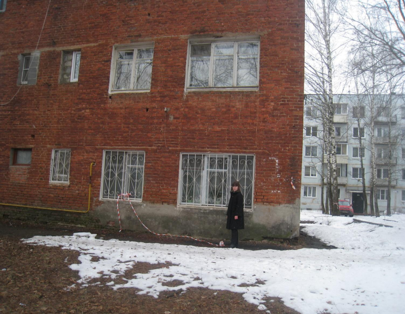
Корпус 3 сейчас