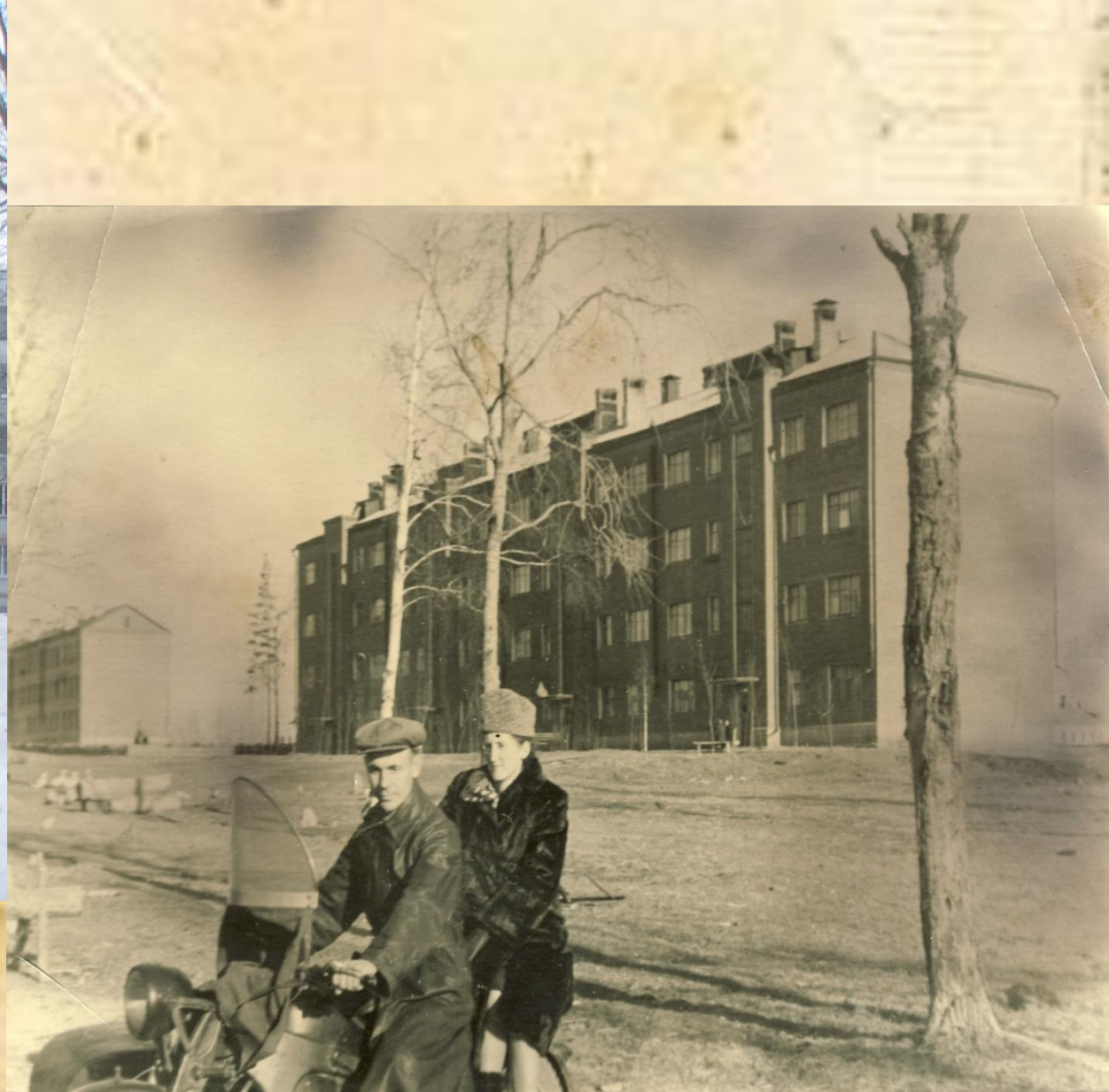
1932-1936 гг. – корпус 3