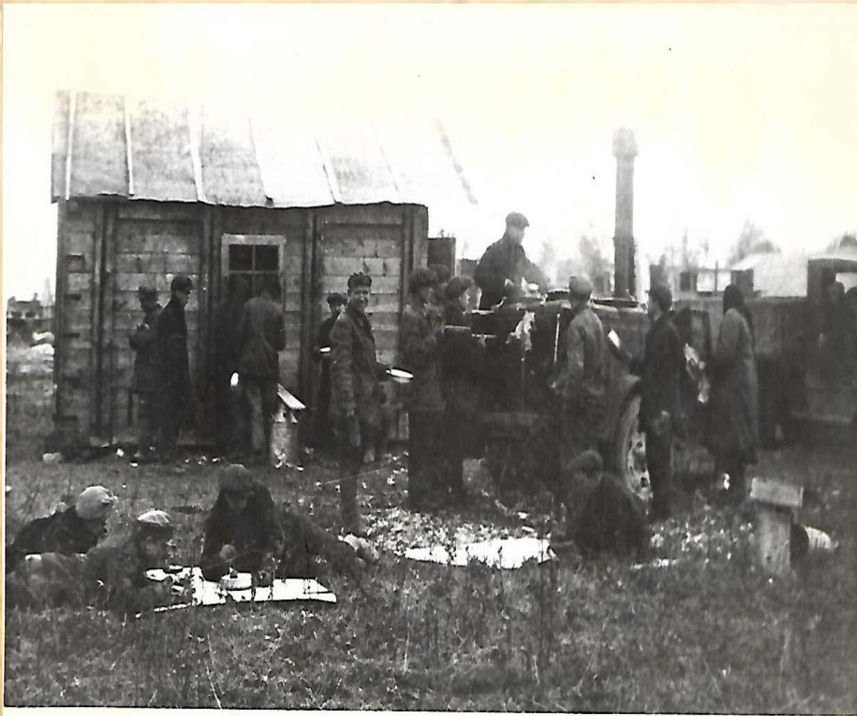
1931 г.- начало строительства Полигона