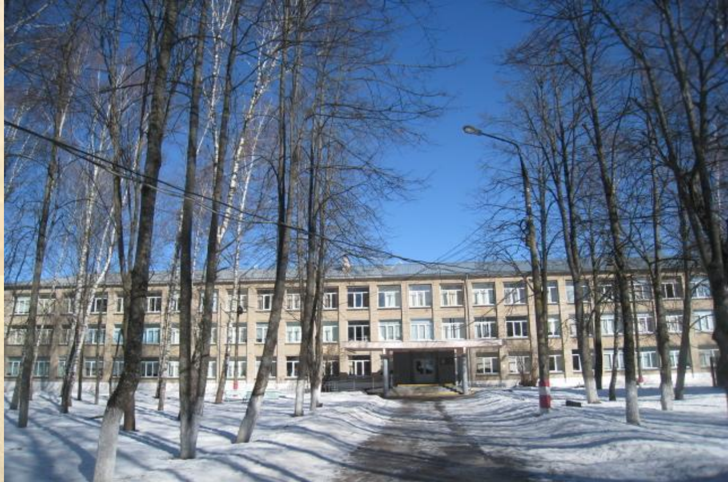
Наша любимая школа сегодня