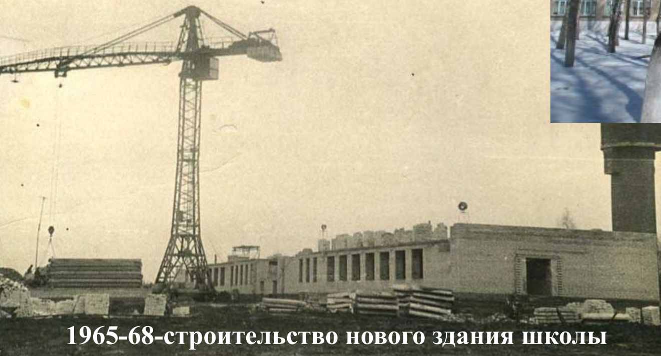
1965-68-строительство нового здания школы