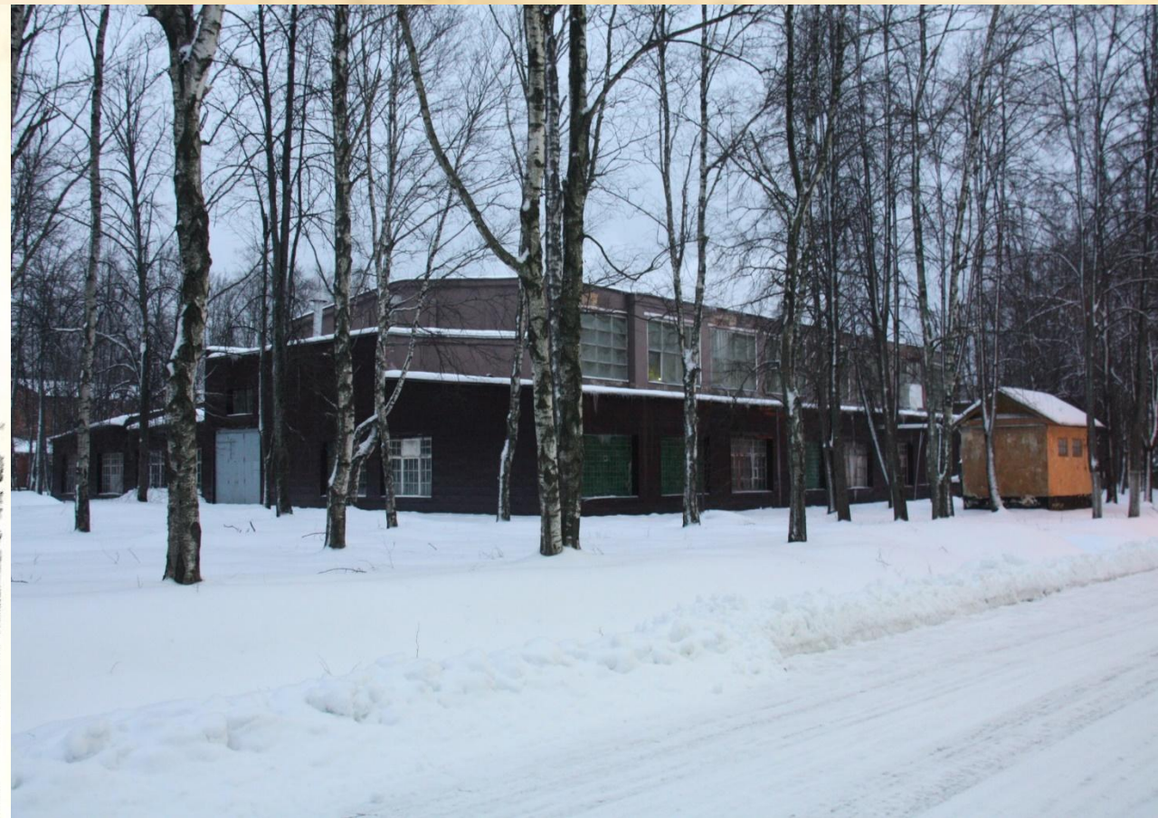
Корпус «Б» сейчас