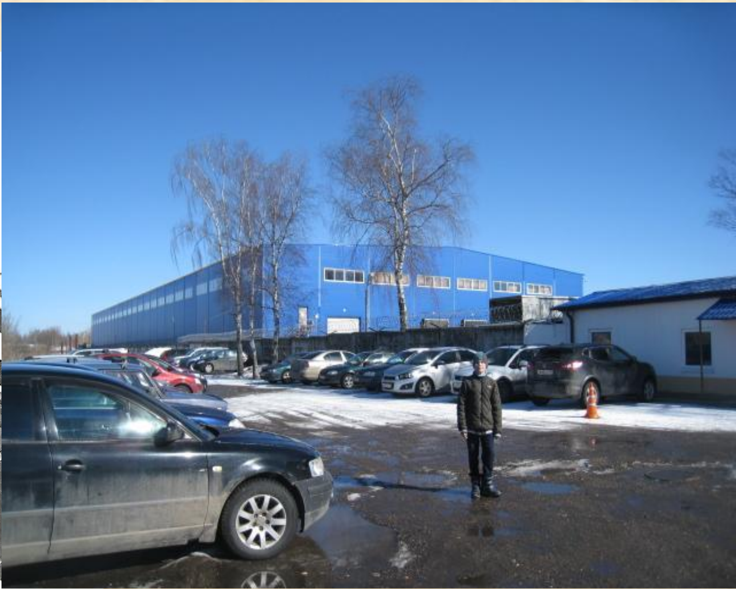
Сейчас на месте корпуса «А» велозавод