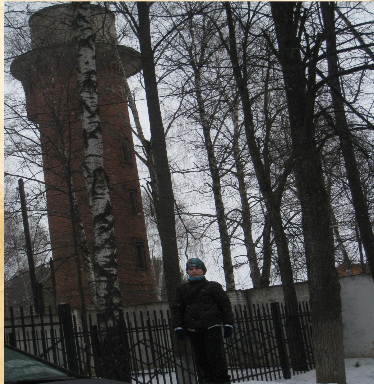
Водонасосная башня сейчас