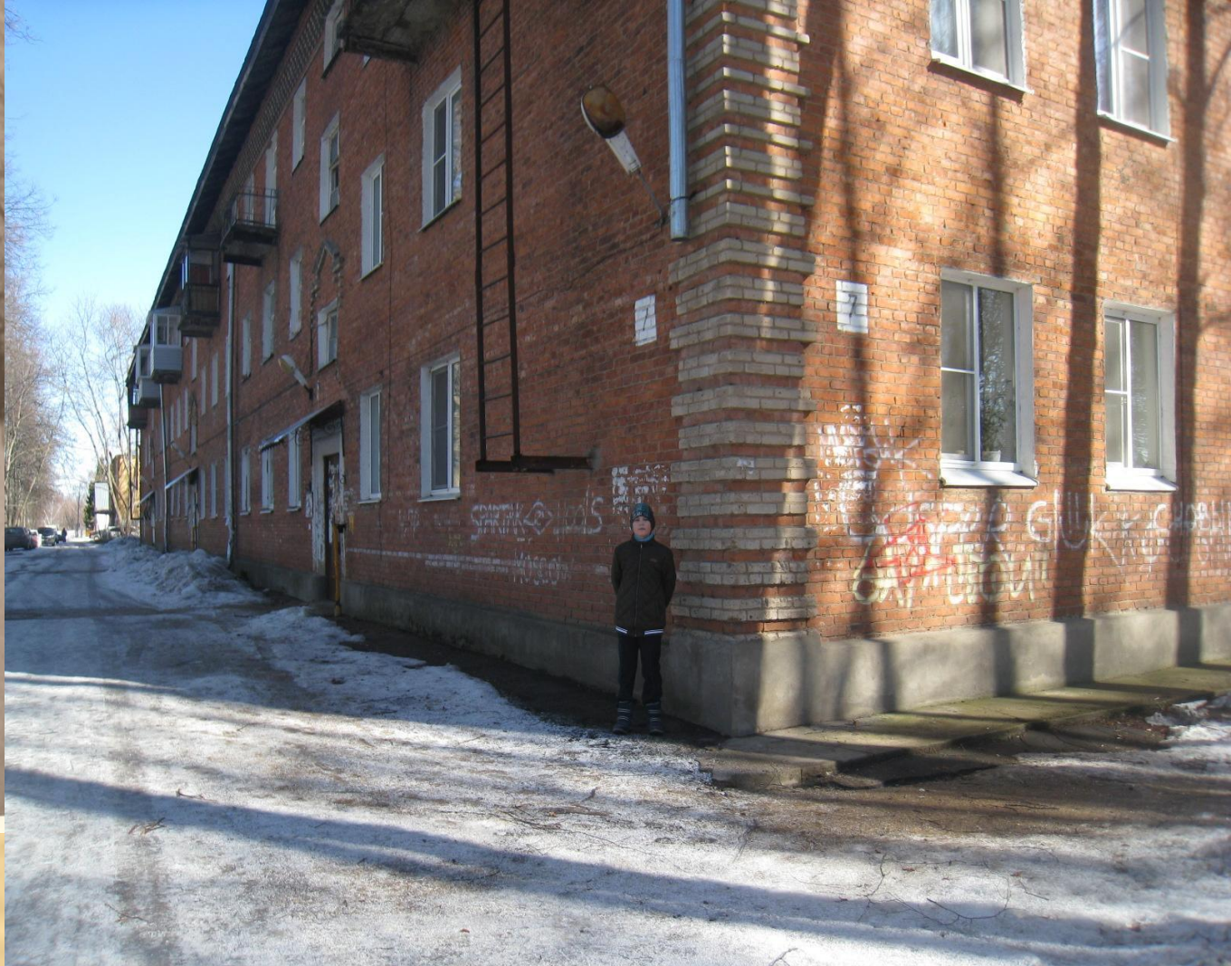
Корпус 7 вчера и сегодня