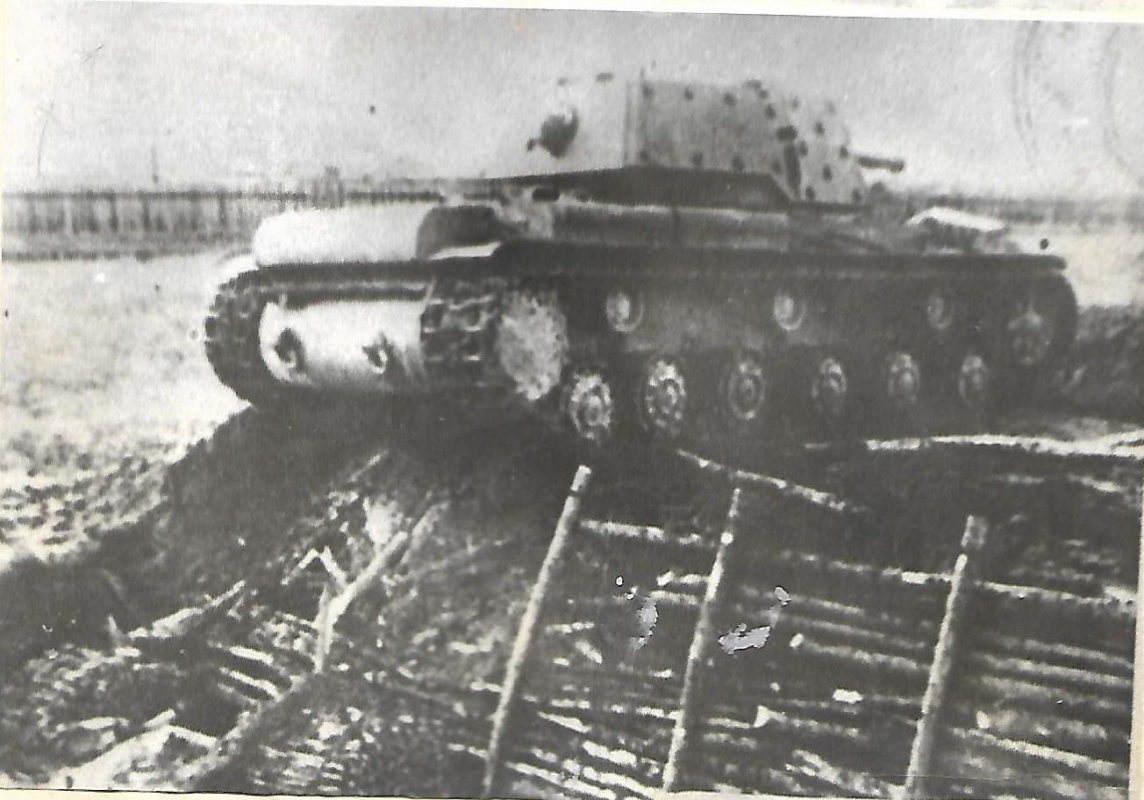
Танк КВ-1 на испытаниях. 1938 год.