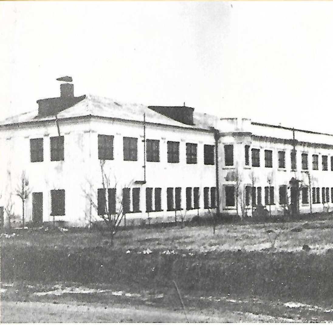
Лабораторный корпус «А», основанный в 1938 году