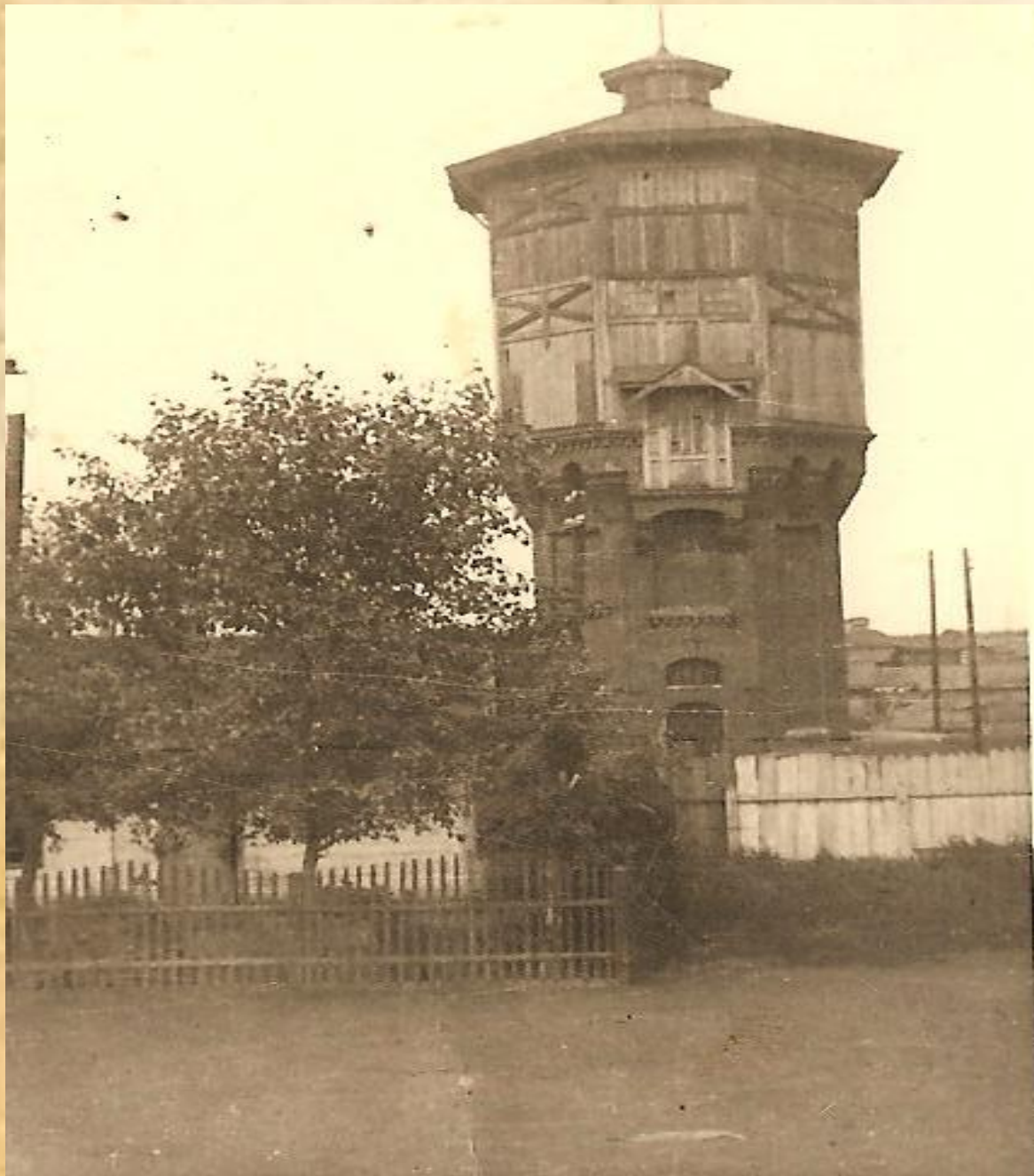
Водонасосная башня 1937 год