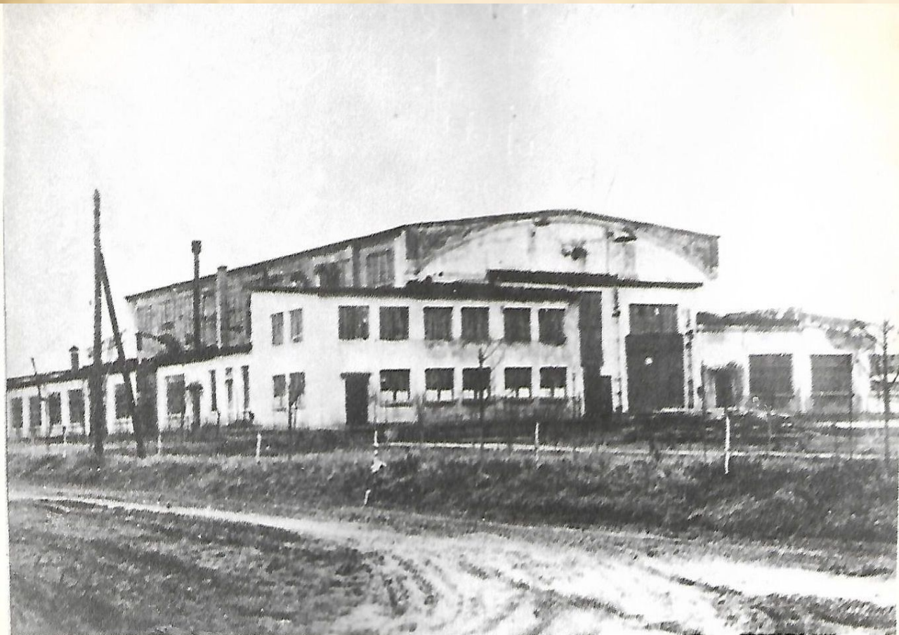
Производственный корпус «Б», основанный в 1938 году