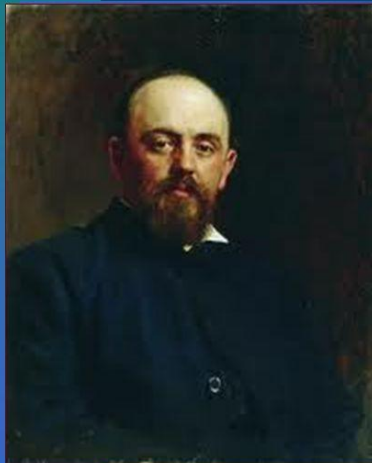
Савва Иванович Мамонтов (1841-1918)