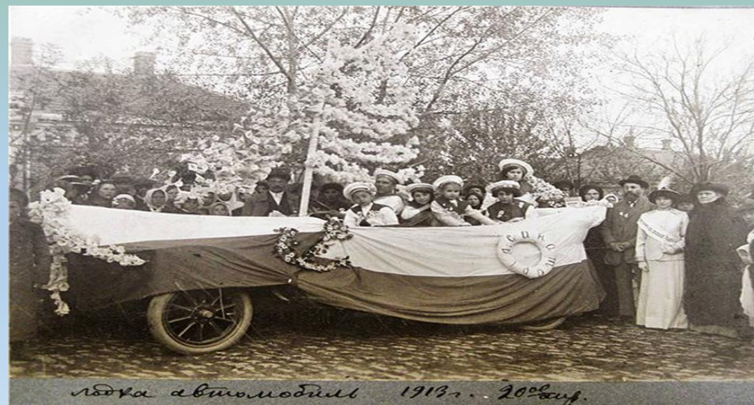
Лодка автомобил 1913 г. 20% инф.