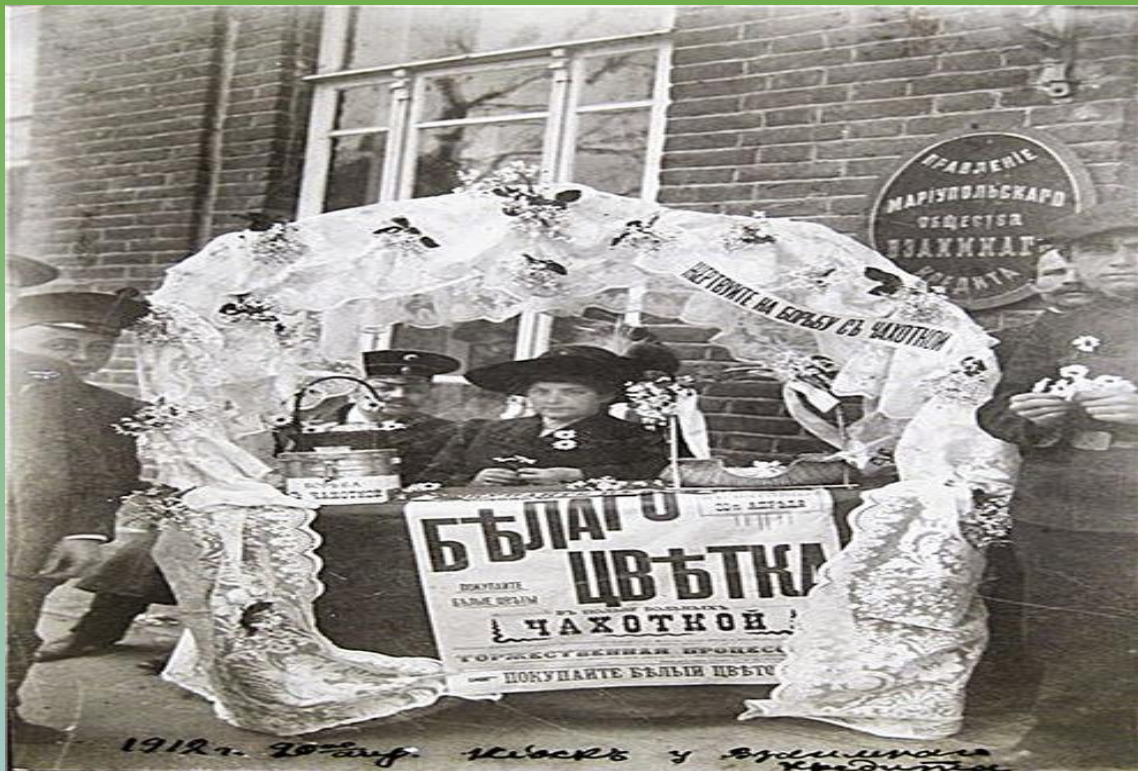
1912 г. 20% инф. Москва и Владимир