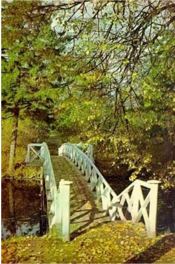
Пушкинское Болдино - ПАРК.

Большо́е Бо́лдино - село в Нижегородской области, административный центр Большеболдинского сельсовета и Большеболдинского района.