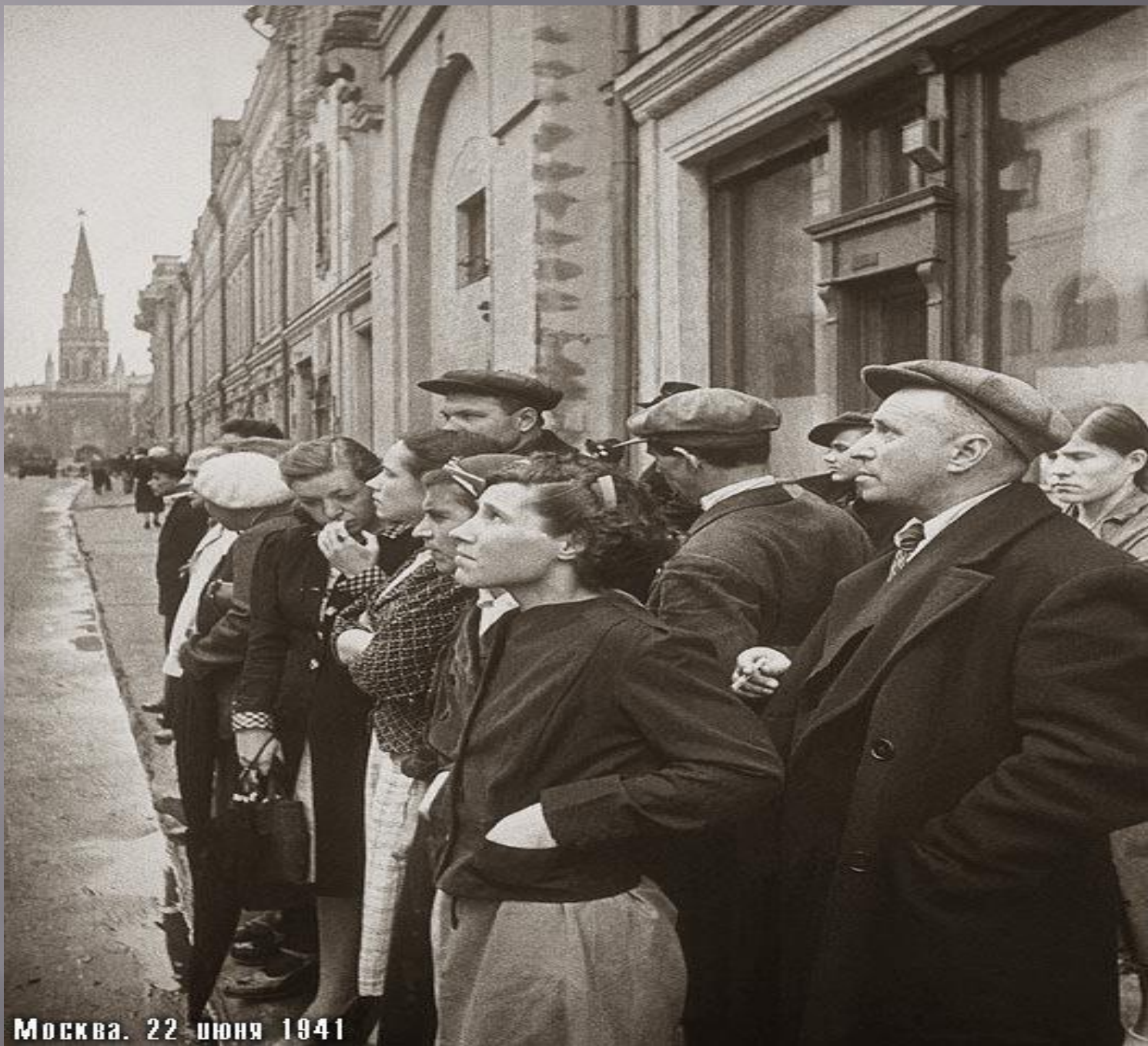
Москва. 22 июня 1941