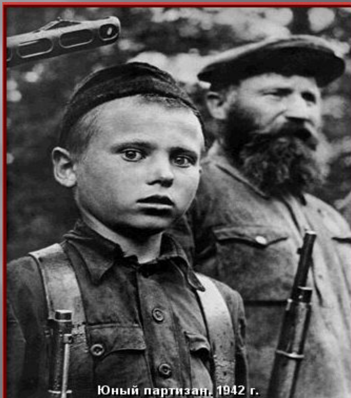
Юный партизан. 1942 г.