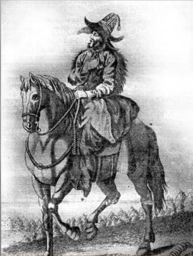
Гравюра, изображающая Эуштинского князя Тояна

Вопрос №1. В какой город эуштинский князь тоян отправился писать челобитную о создании города в его вотчине в томи?