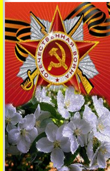
СМИРНОВ НИКОЛАЙ ВАСИЛЬЕВИЧ