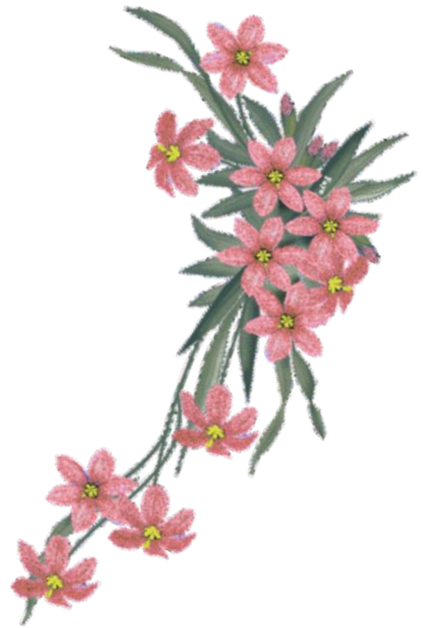
БИТНЕР ЗИНАИДА АЛЕКСЕЕВНА