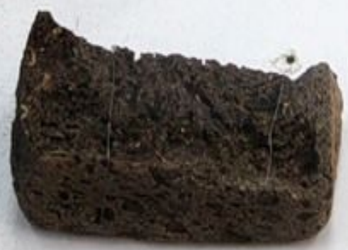
Вот он, блокадный кусочек хлеба. Сто двадцать пять граммов на весь день.