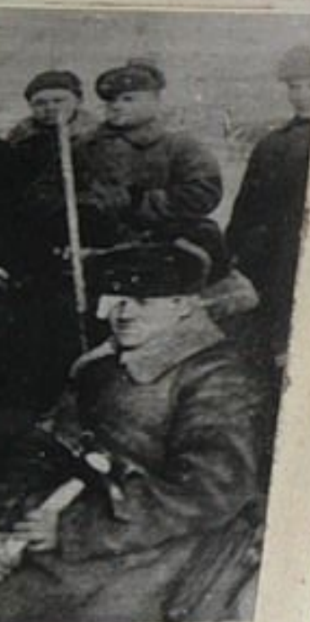
...ола Пантелеев ...нт С. Я. Зубин.