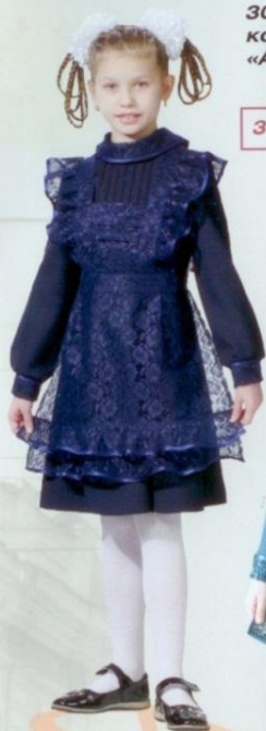
30-08 комплект «Алиса»

30-9-08 платье 60/128-134 30-10-08 фартук 64/122-140 30-11-08 воротник, манжеты 68/128-146 50% шерсть, 50% ПЭ 72/134-152 100% ПЭ фартук