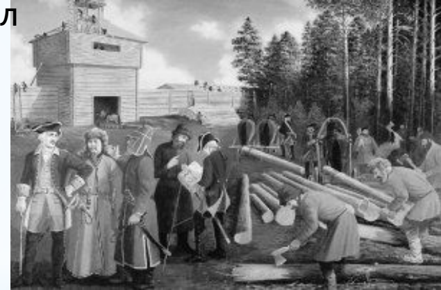
Строительство Челябинской крепости