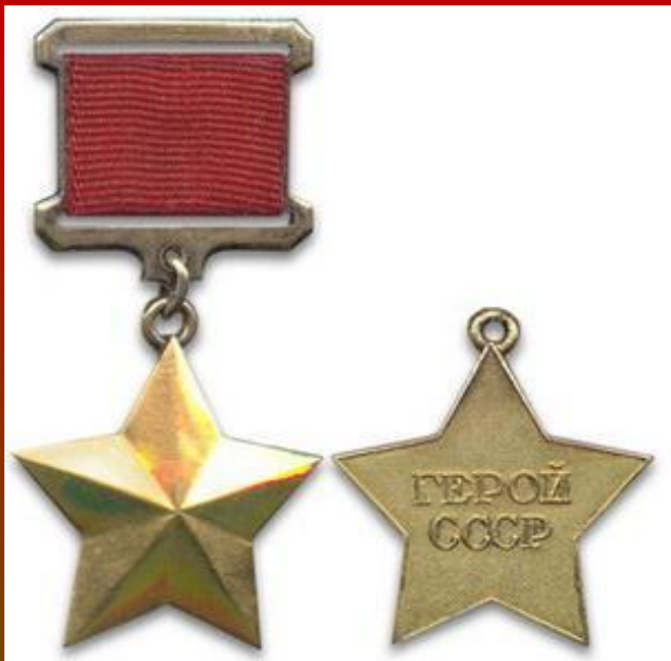
Медаль «Золотая Звезда»

За подвиги, совершённые в годы Великой Отечественной войны, высокого звания удостоено 11 тысяч 657 человек