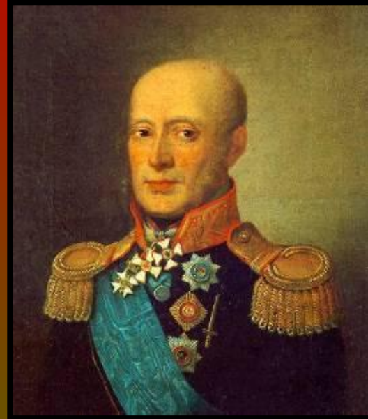
Михаил Богданович Барклай-де-Толли