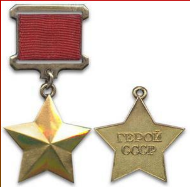
Медаль «Золотая Звезда»

За подвиги, совершённые в годы Великой Отечественной войны, высокого звания удостоено 11 тысяч 657 человек