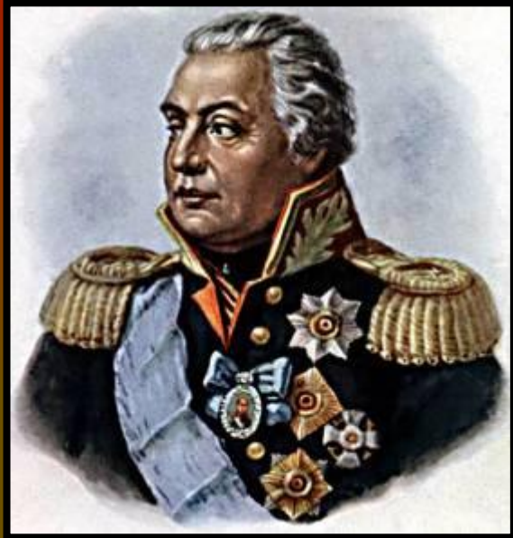
Михаил Илларионович Кутузов