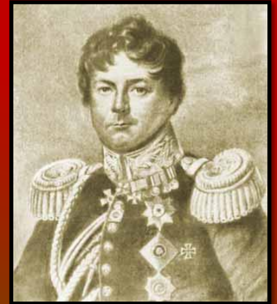
Иван Иванович Дибич-Забалканский