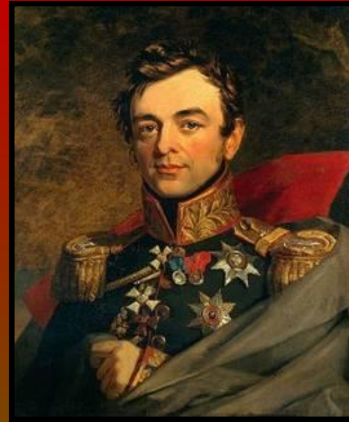
Иван Федорович Паскевич