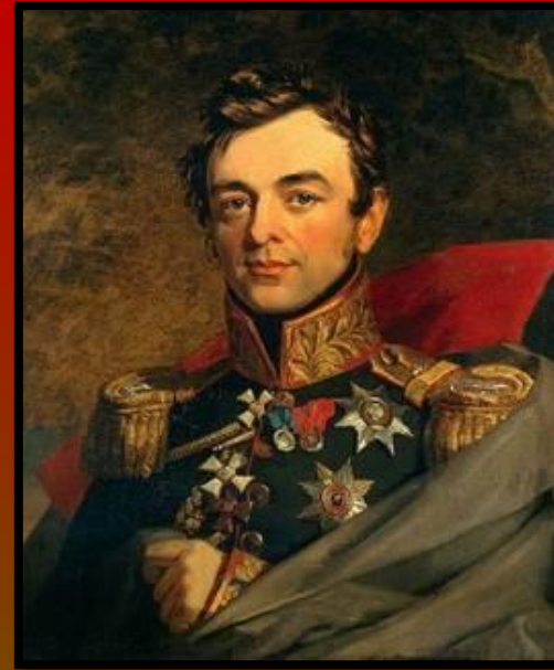
Иван Федорович Паскевич