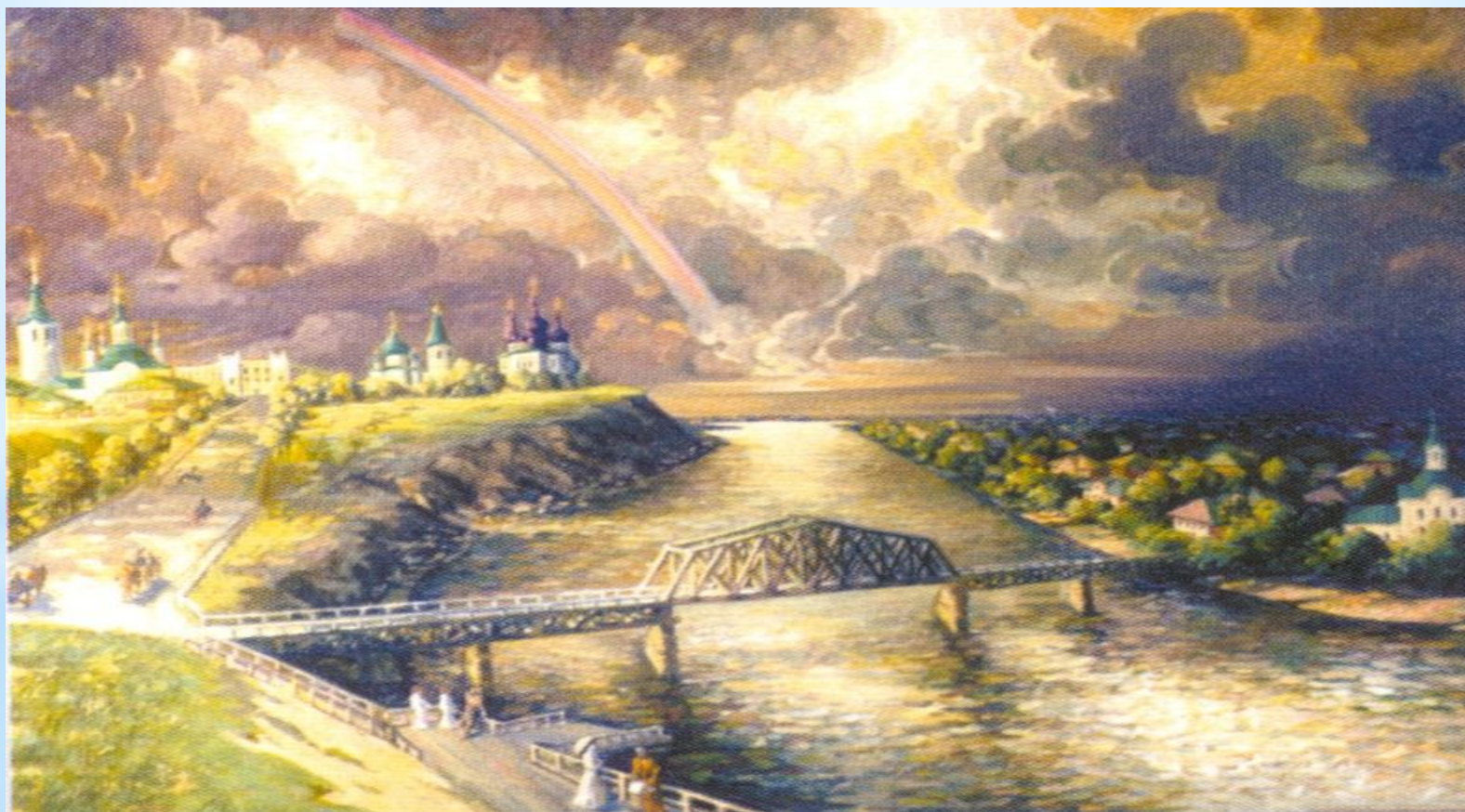
Вид Тюмени в XIX в.

Торгово-промышленным центром являлась Тюмень. Находясь на пересечении торговых путей между Западом и Востоком, Тюмень превратилась в "ворота Сибири". Через Тюмень проходил путь переселенцев из Европейской части Росси после отмены крепостного права и в годы Столыпинской аграрной реформы.