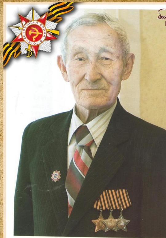
Юсуп Рахметович Бухаев – полный кавалер ордена Славы