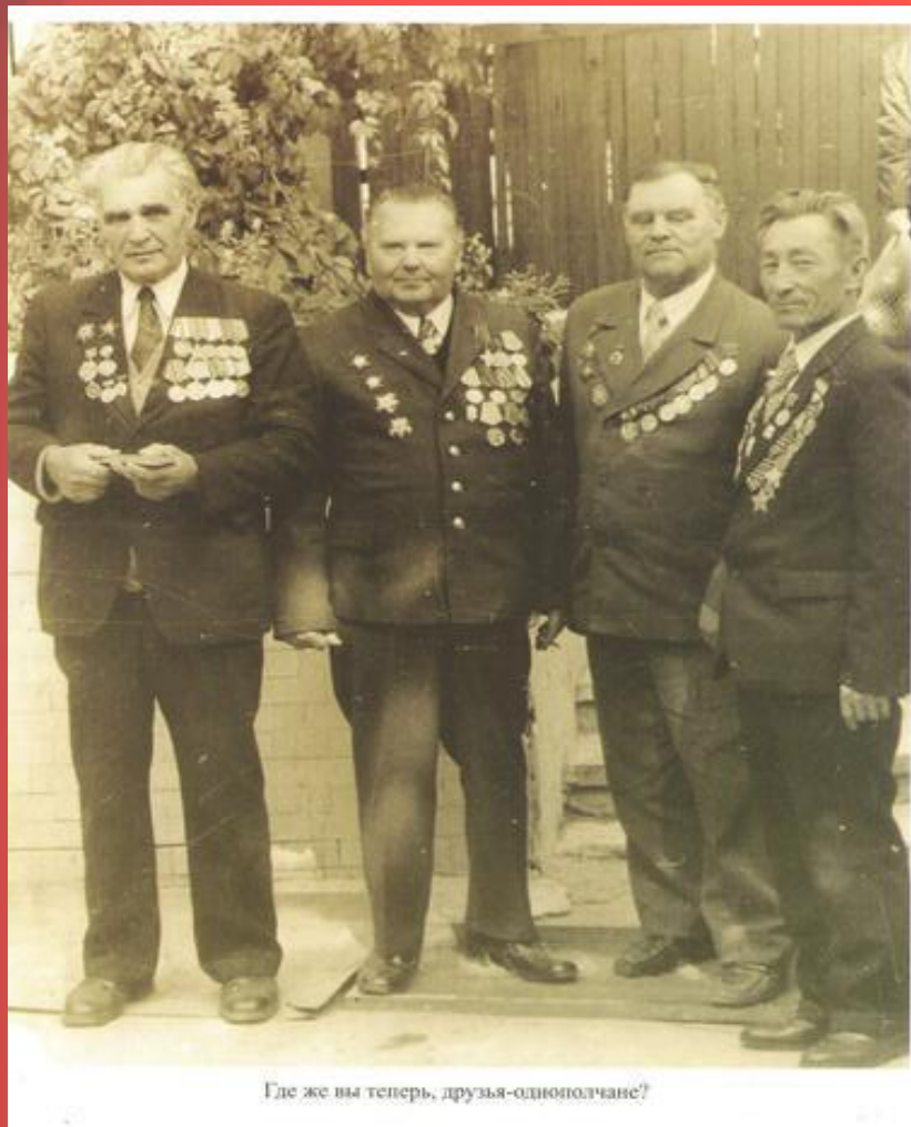
Где же вы теперь, друзья-однополчане?