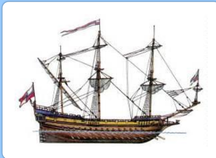
«Апостол Пётр» - первый большой боевой корабль русского флота