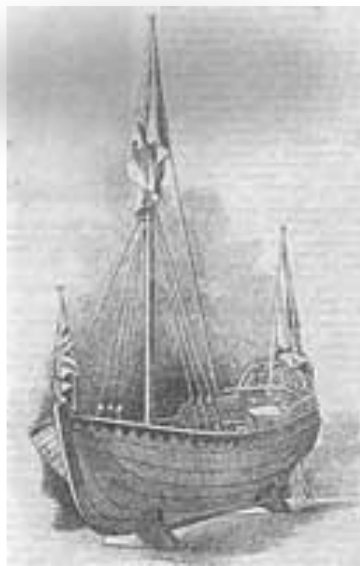
Ботик Петра Первого, «дедушка русского флота»

Подлинным создателем военно-морского флота России стал Пётр I. Ещё молодым он начал интересоваться кораблями и совершать учебные плавания по озеру. Он понял, что успешное ведение войны зависит от хорошо организованных совместных действий армии и флота. В итоге за неслыханно короткий срок (с ноября 1695 по май 1696 г.) были построены 36-пушечные корабли «Апостол Пётр» и «Апостол Павел», 4 брандера, 23 галеры, 1 300 морских лодок, плотов и стругов. Русская армия при поддержке боевых кораблей взяла турецкую крепость Азов. Была одержана первая крупная победа в войне за выход к морю.