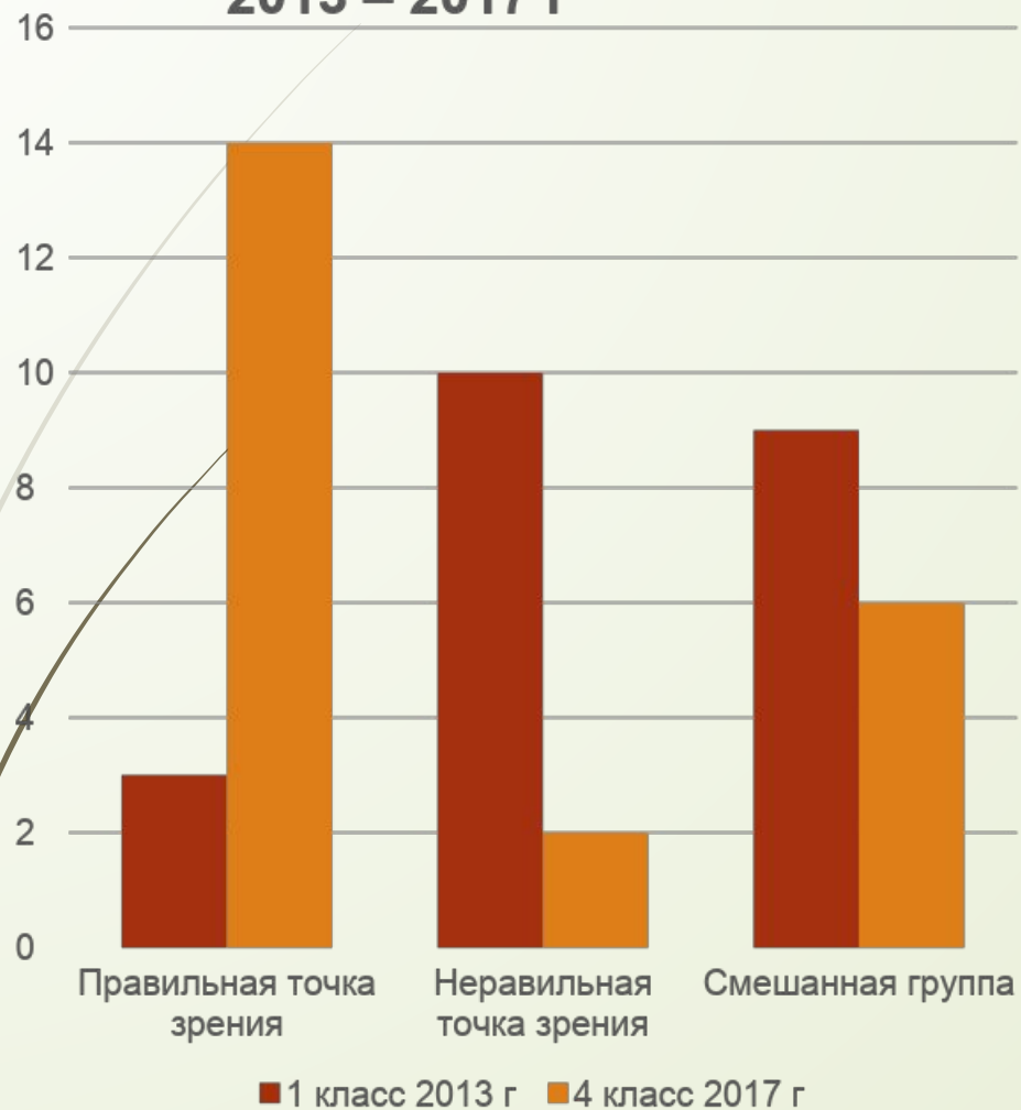
Результат работы 1 – 4 класс 2013 – 2017 г