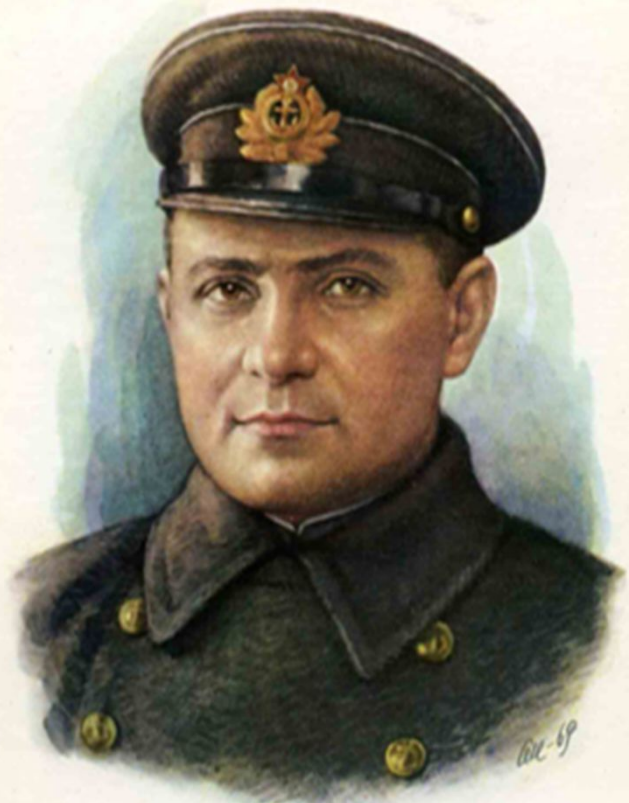
Герой Советского Союза ЦЕЗАРЬ ЛЬВОВИЧ КУНИКОВ