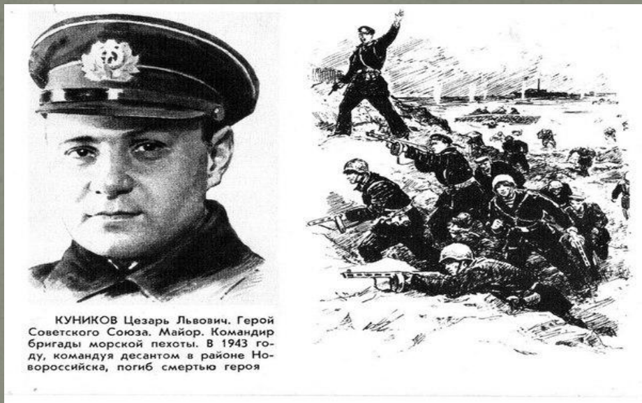
КУНИКОВ Цезарь Львович. Герой Советского Союза. Майор. Командир бригады морской пехоты. В 1943 году, командуя десантом в районе Новороссийска, погиб смертью героя

Высадка главного десанта провалилась. Единственным способом создать плацдарм оказалась второстепенная операция, целью которой была маскировка и отвлечение от главного удара. Десант под командованием Куникова численностью всего лишь 275 человек, потеряв лишь одного убитым и троих ранеными, ночью высадился на крутом безводном берегу у поселка Станичка.