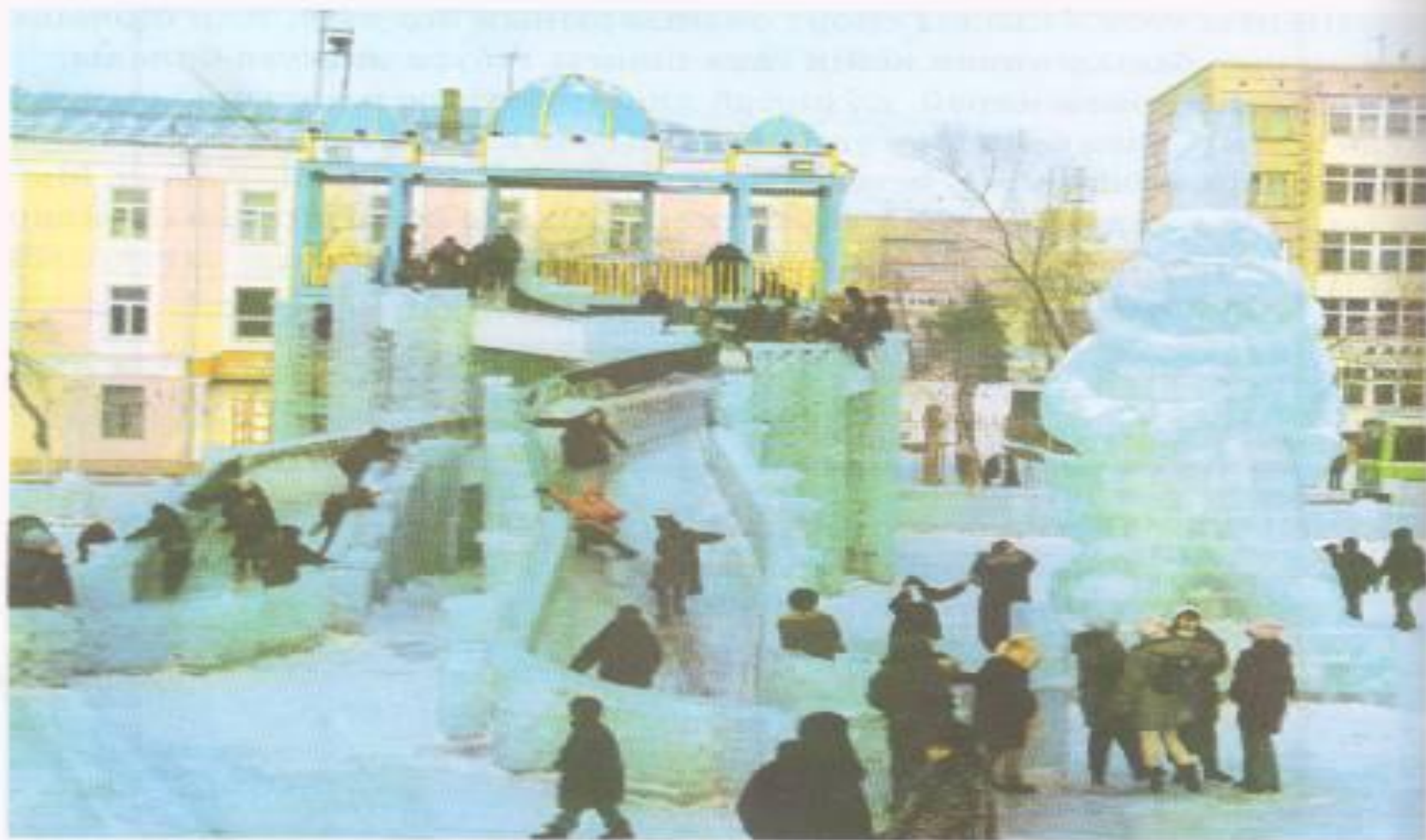
Мұз қалашық. Астана қаласы.