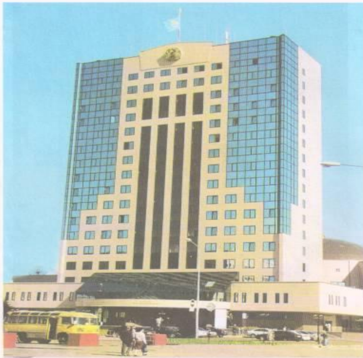
Парламент үйі. Астана қаласы.