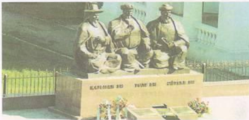
«Қазыбек би, Төле би, Әйтеке би» ескерткіші. Астана қаласы.