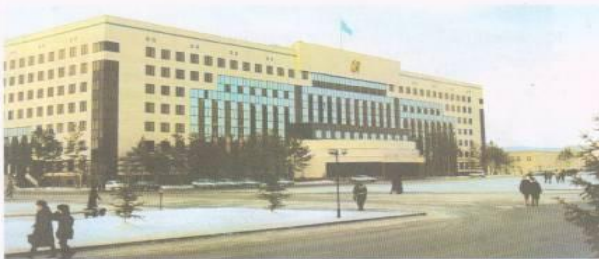
Үкімет үйі. Астана қаласы.