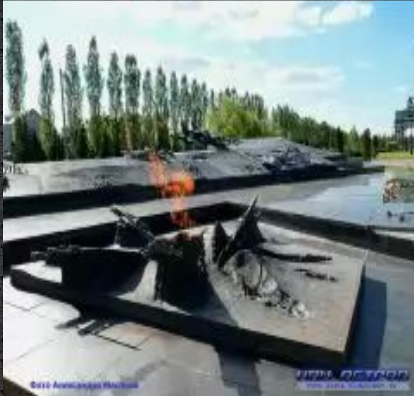
Памятник неизвестному солдату