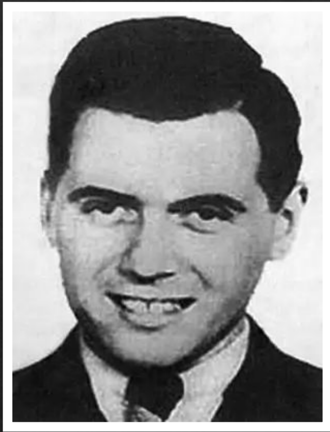
Йозеф Менгеле «Ангел смерти»