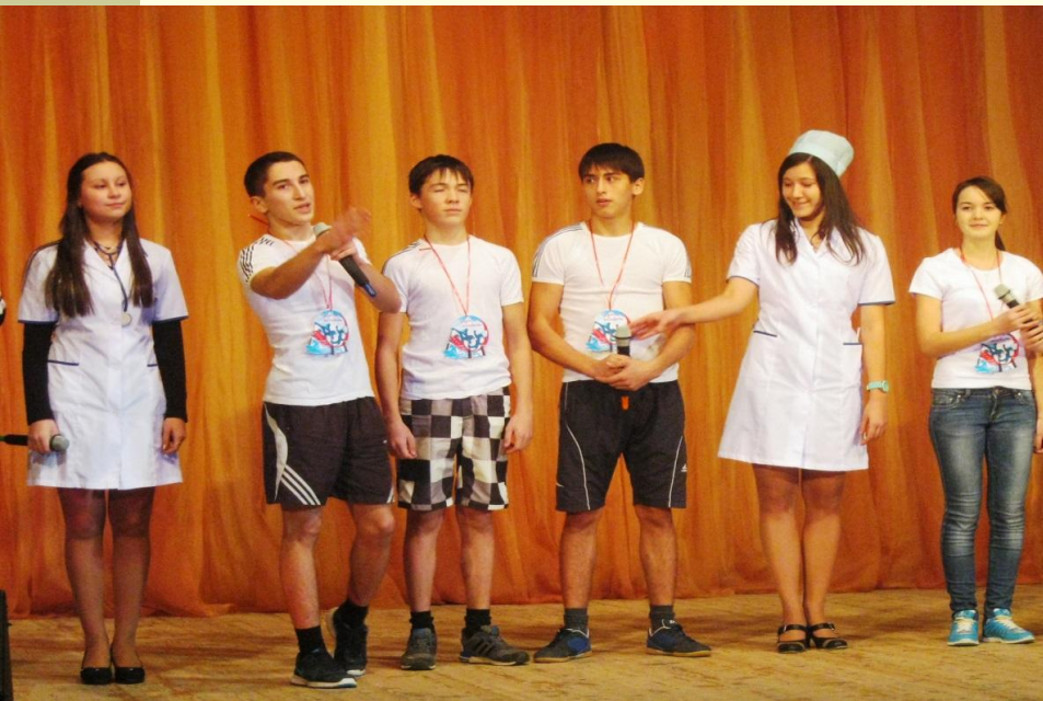
Команда «Здоровая молодёжь», акция «Город без наркотиков» - 1 место

Ведь у нас талантов много: Есть танцоры и певцы, Есть художники, артисты, Все ребята-молодцы!