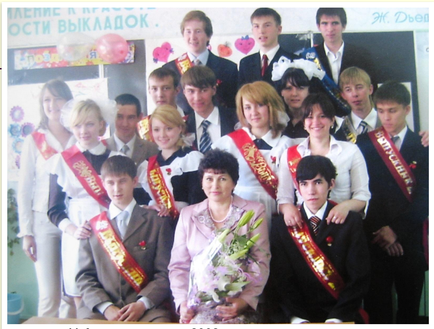
11 А класс, выпуск 2008года