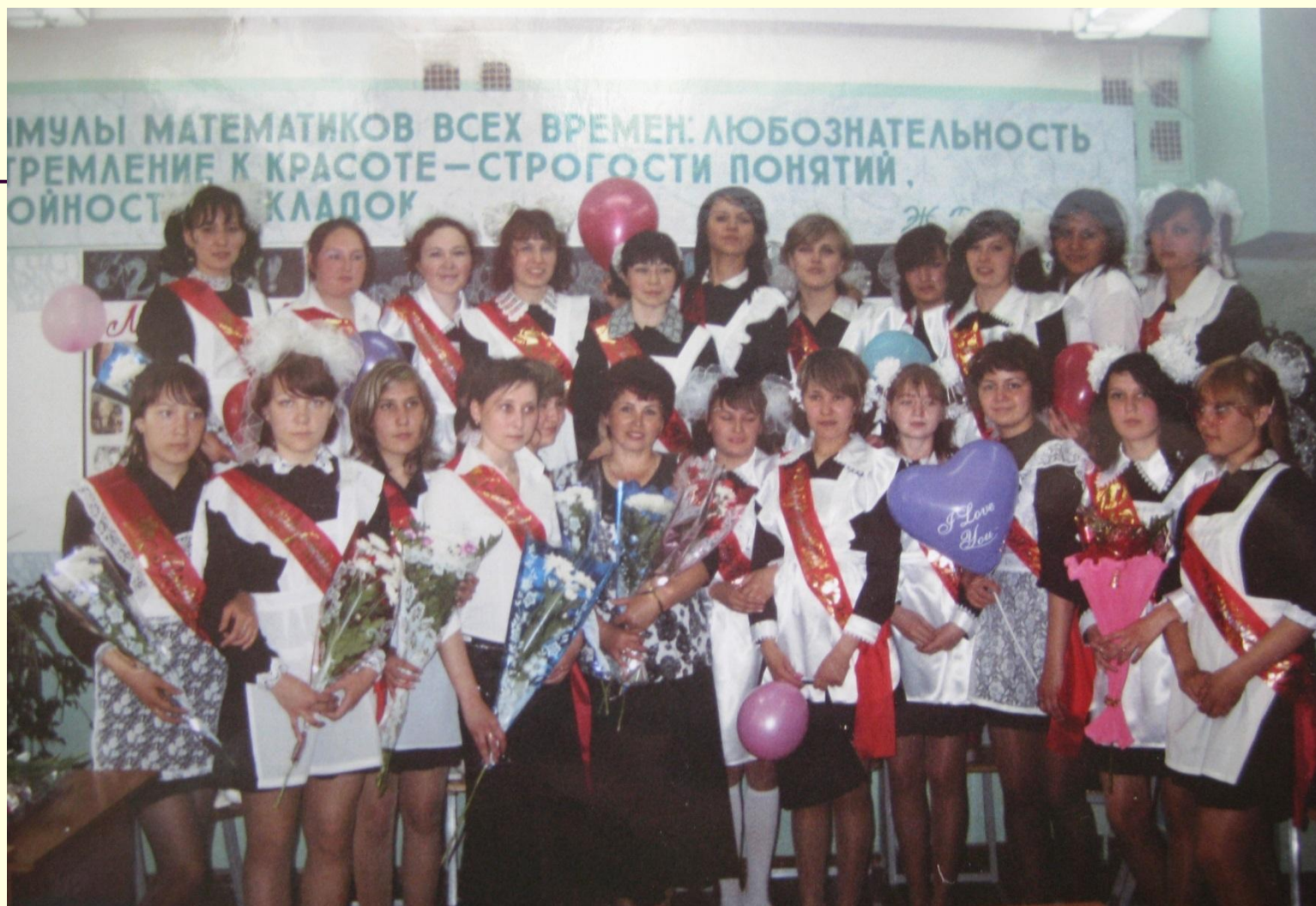
11 А класс, 2006 год