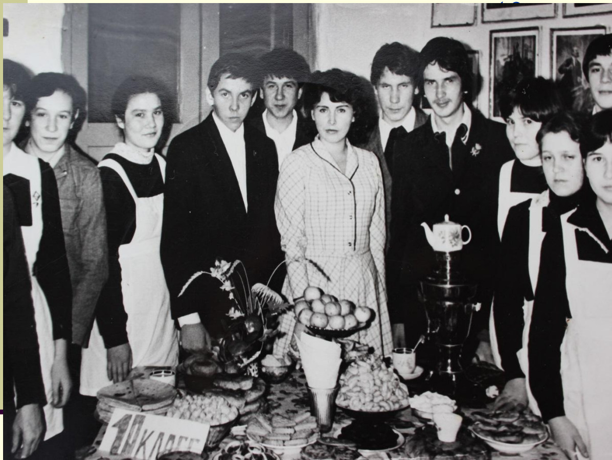
Новомедведевская средняя школа, Илишевский р-н, 1983 г.

Пришла учительница в класс, Сама чуть-чуть постарше нас, И провела такой урок, Что мы забыли про звонок. Нам хотелось больше знать, И взрослыми быстрее стать, И выбрать в жизни верный путь, И в будущее заглянуть.