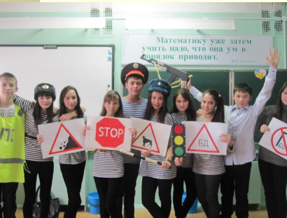
Команда «Зebra» 8а класса, 2013 г.