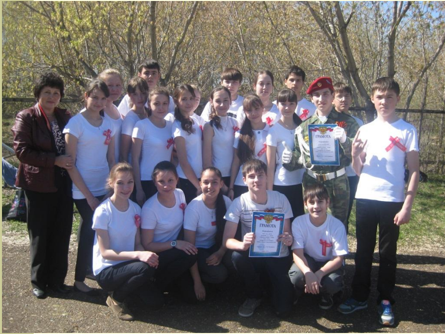
8а класс. Конкурс смотра строя и песни, 2013 г. Команда «Спецназ»-1 место.