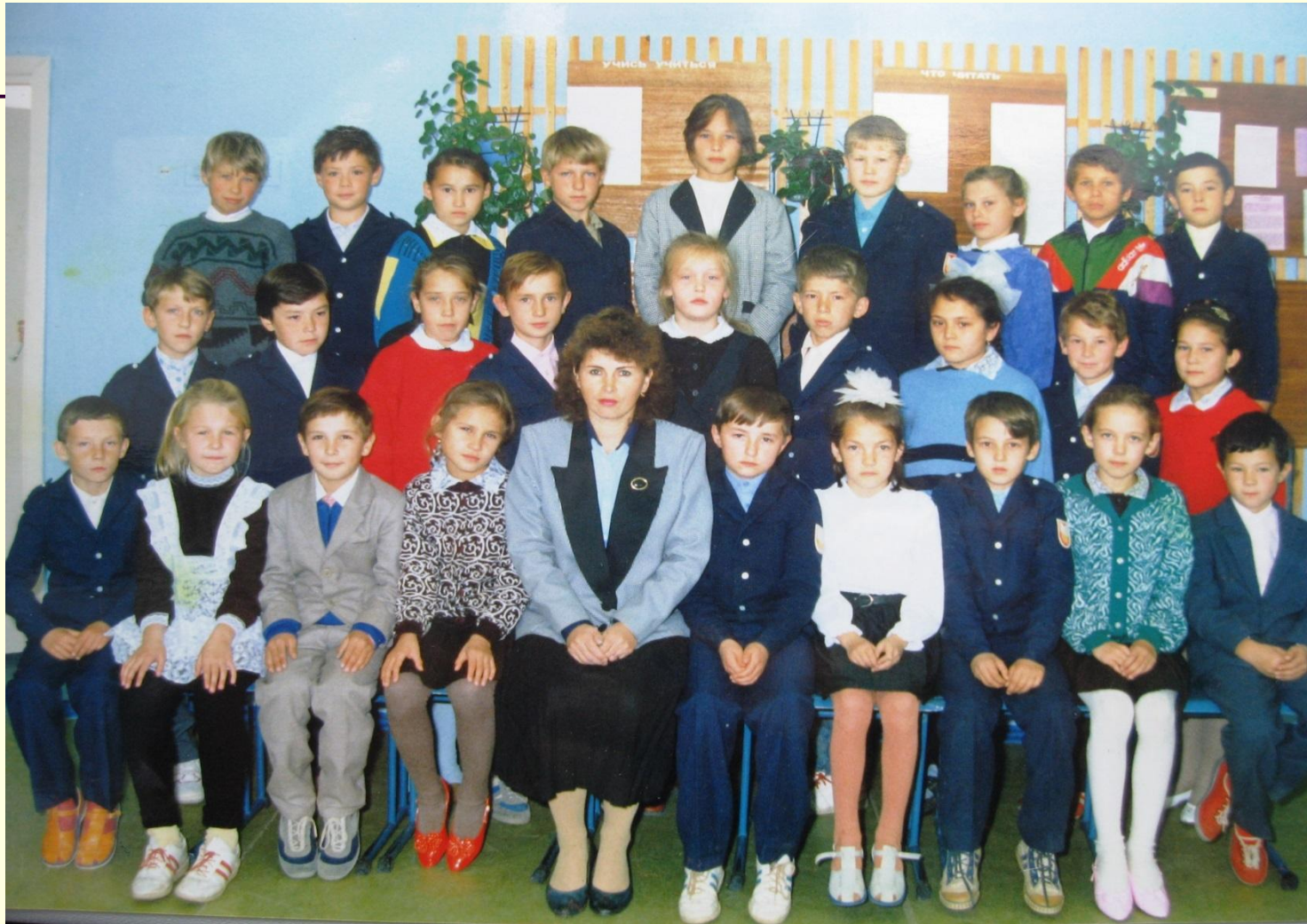
МОБУ СОШ №2 г.Агидель, 5 Ж класс, 1994