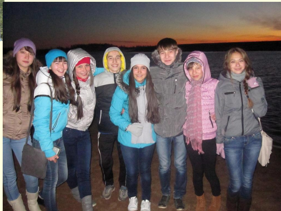
Экскурсия на природу, октябрь 2013г.