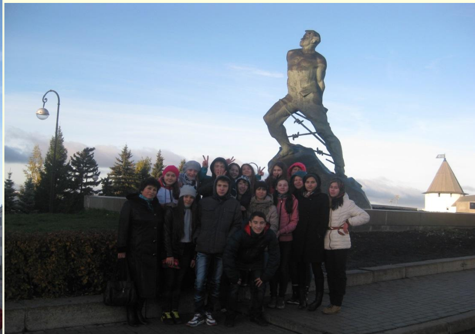
У памятника Мусы Джалиля, Казань, 2013 г.