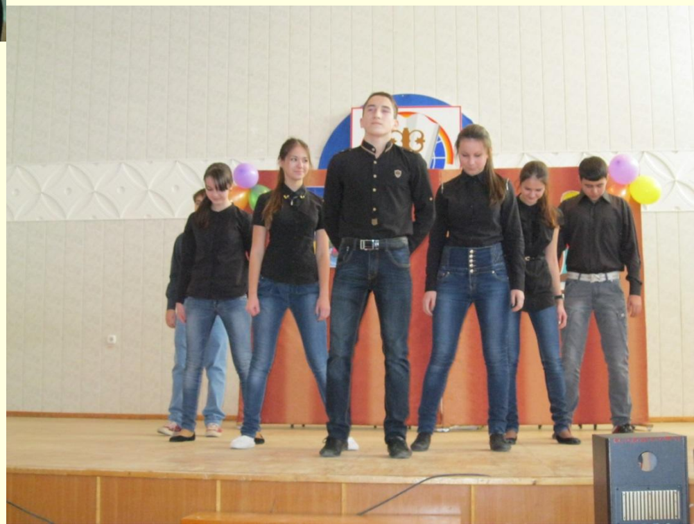
Команда «БЭМС» 9а класса, 2014 г.