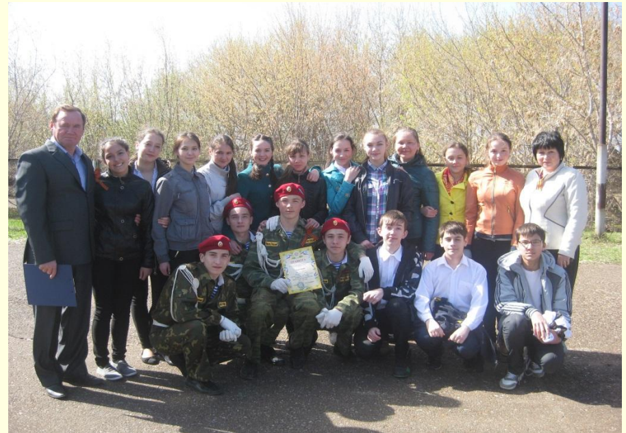
9а класс. Конкурс смотра строя и песни, 2014 г. Команда «Победа» -1 место