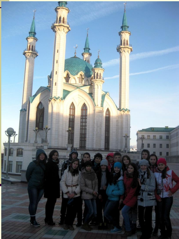
Мечеть Кул Шариф