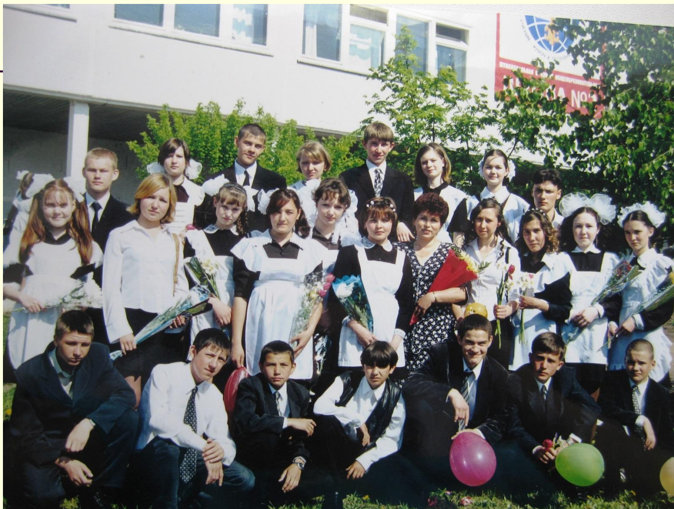
9 И класс, 2004 год