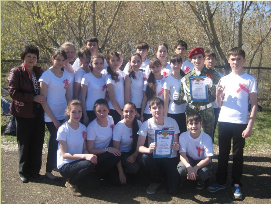
8а класс. Конкурс смотра строя и песни, 2013 г. Команда «Спецназ»-1 место.