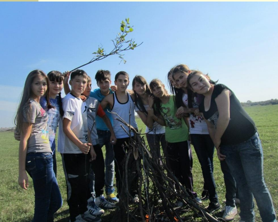
Экскурсия на природу, май 2013 г.

Пойми живой язык природы — И скажешь ты: прекрасен мир!