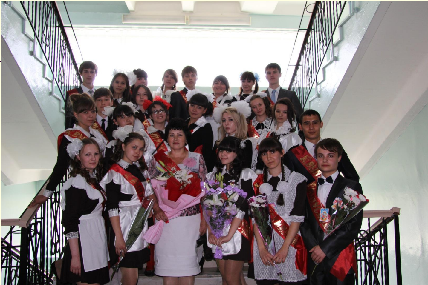
11 А класс, 2012 год