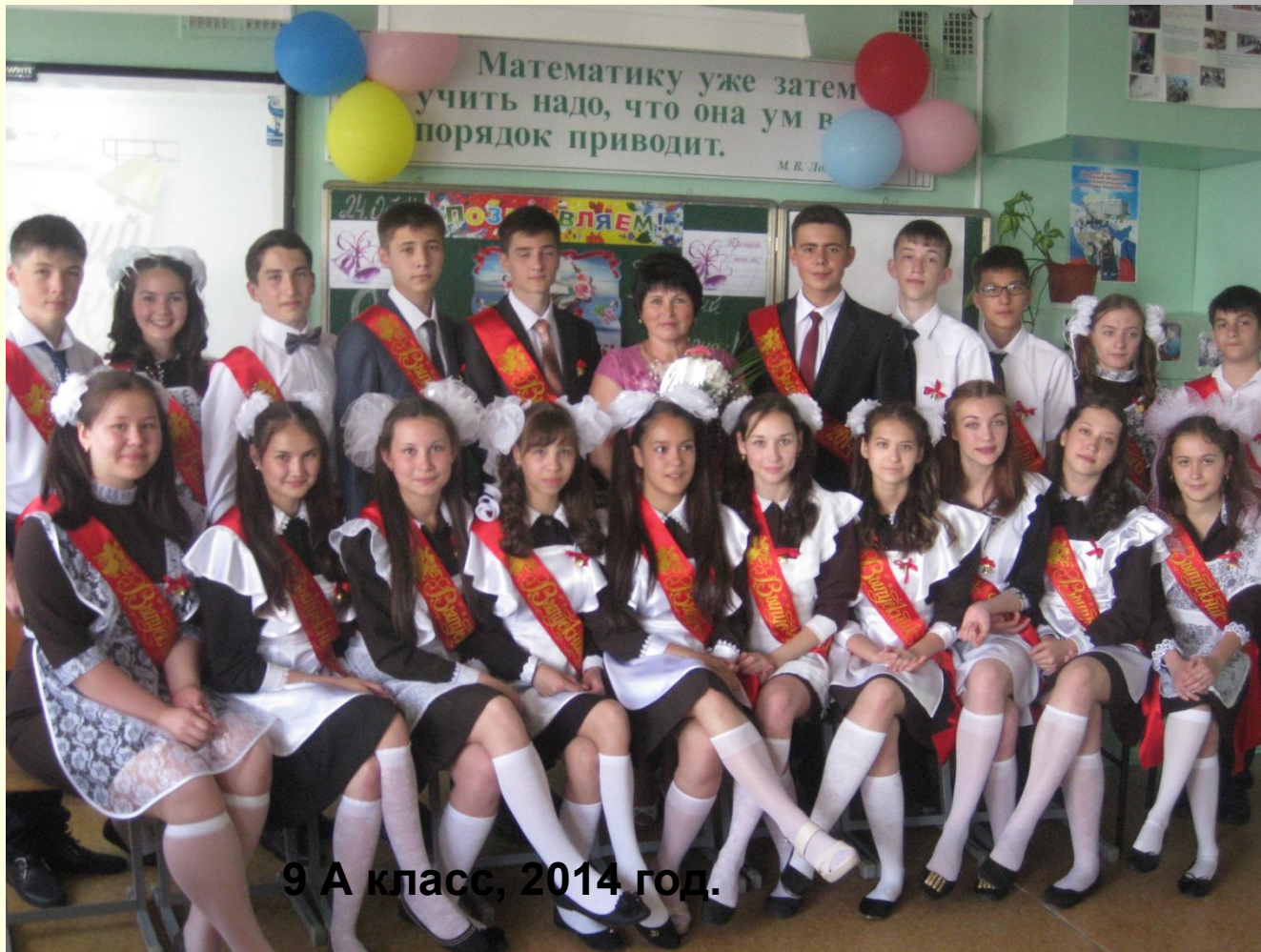
9 А класс, 2014 год.

Перед вами мой 10 – й класс, Я расскажу сейчас о нашей жизни и о нас!