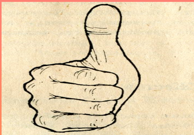
Рис. «Нет проблем»