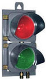
Первый светофор появился в 1868 году в Лондоне.