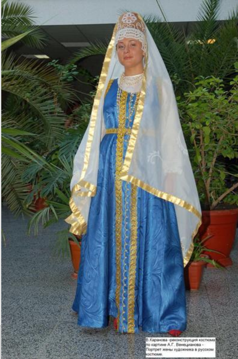
В. Карачова - реконструкция костюма по картине А.Г. Венецианова - Портрет жены художника в русском костюме.