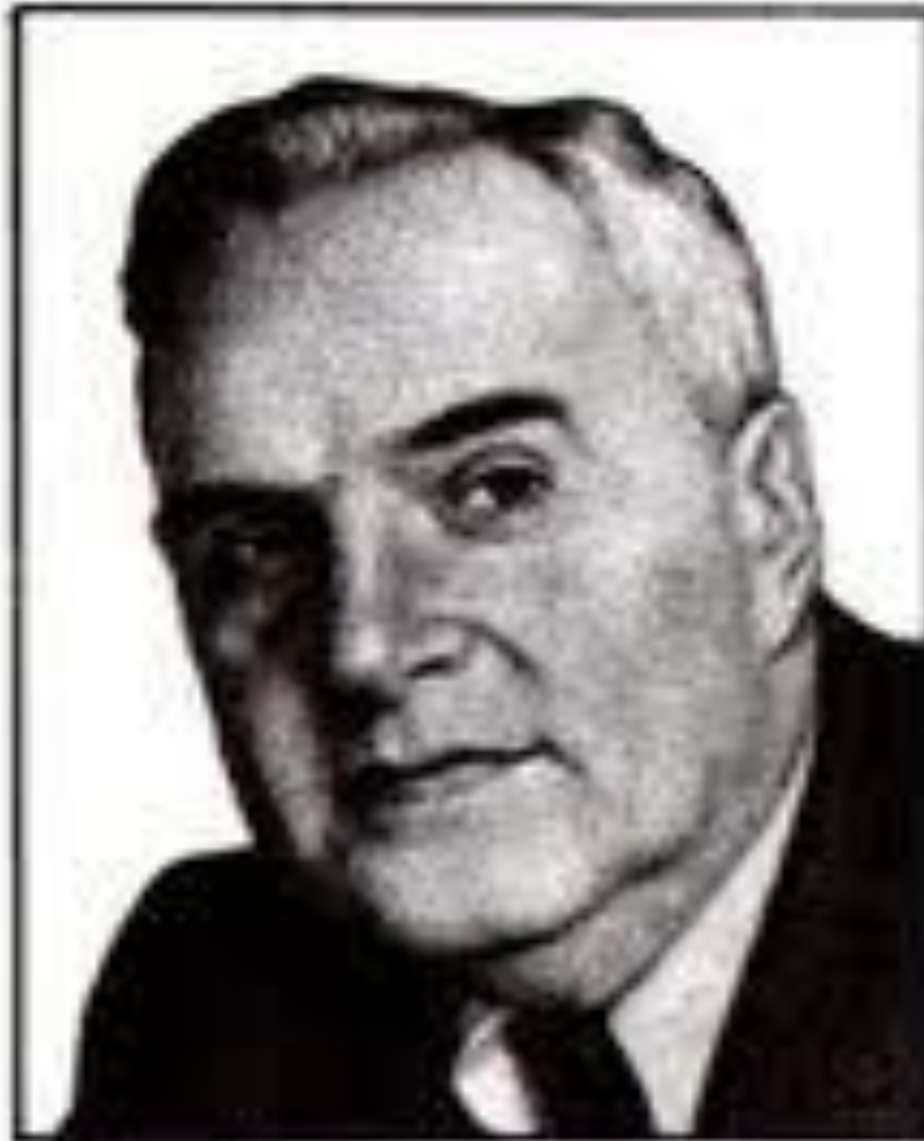
Полканов А.И. – видный историк, археолог, этнограф.