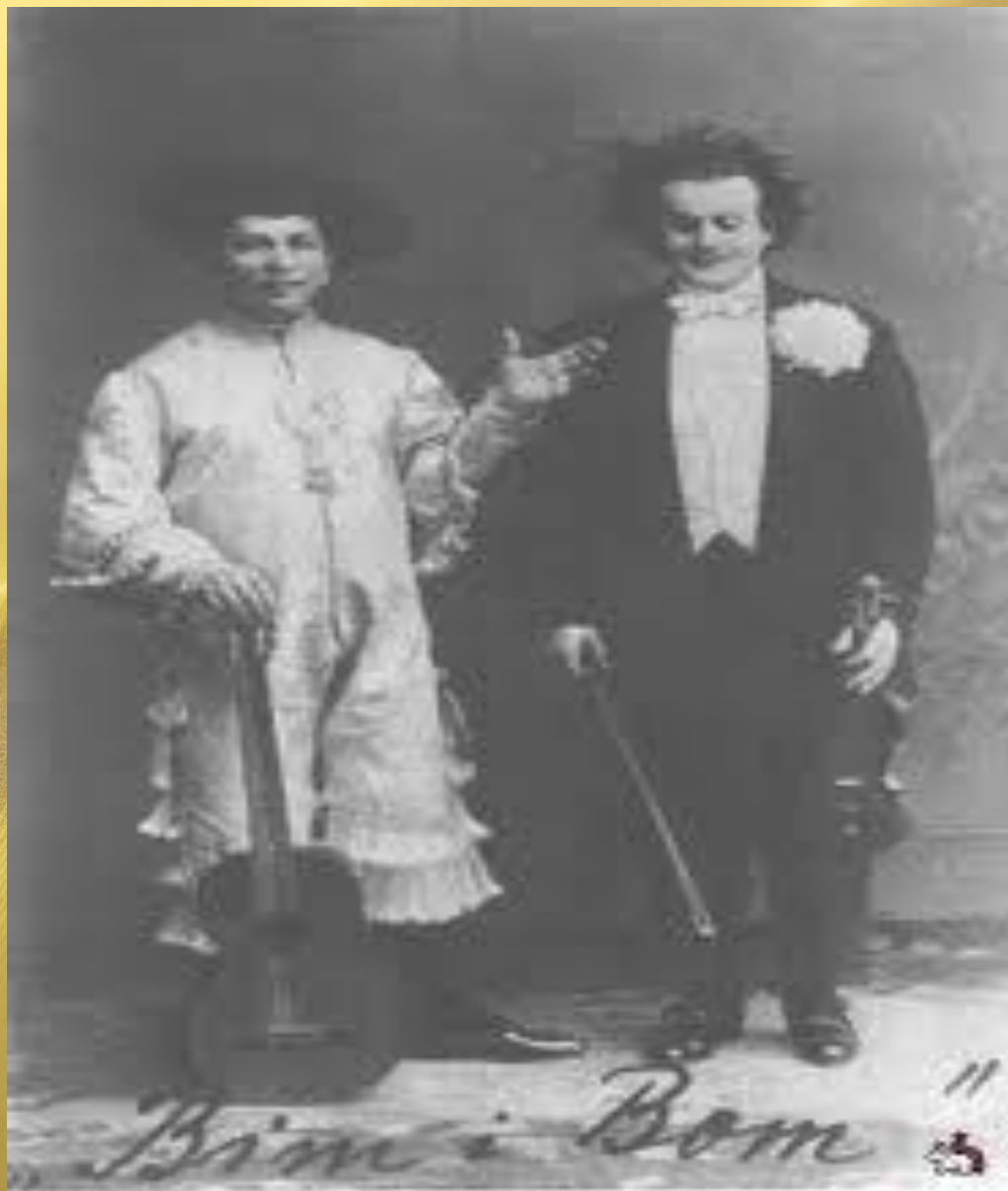
Бим и Бом — корифеи клоунады.