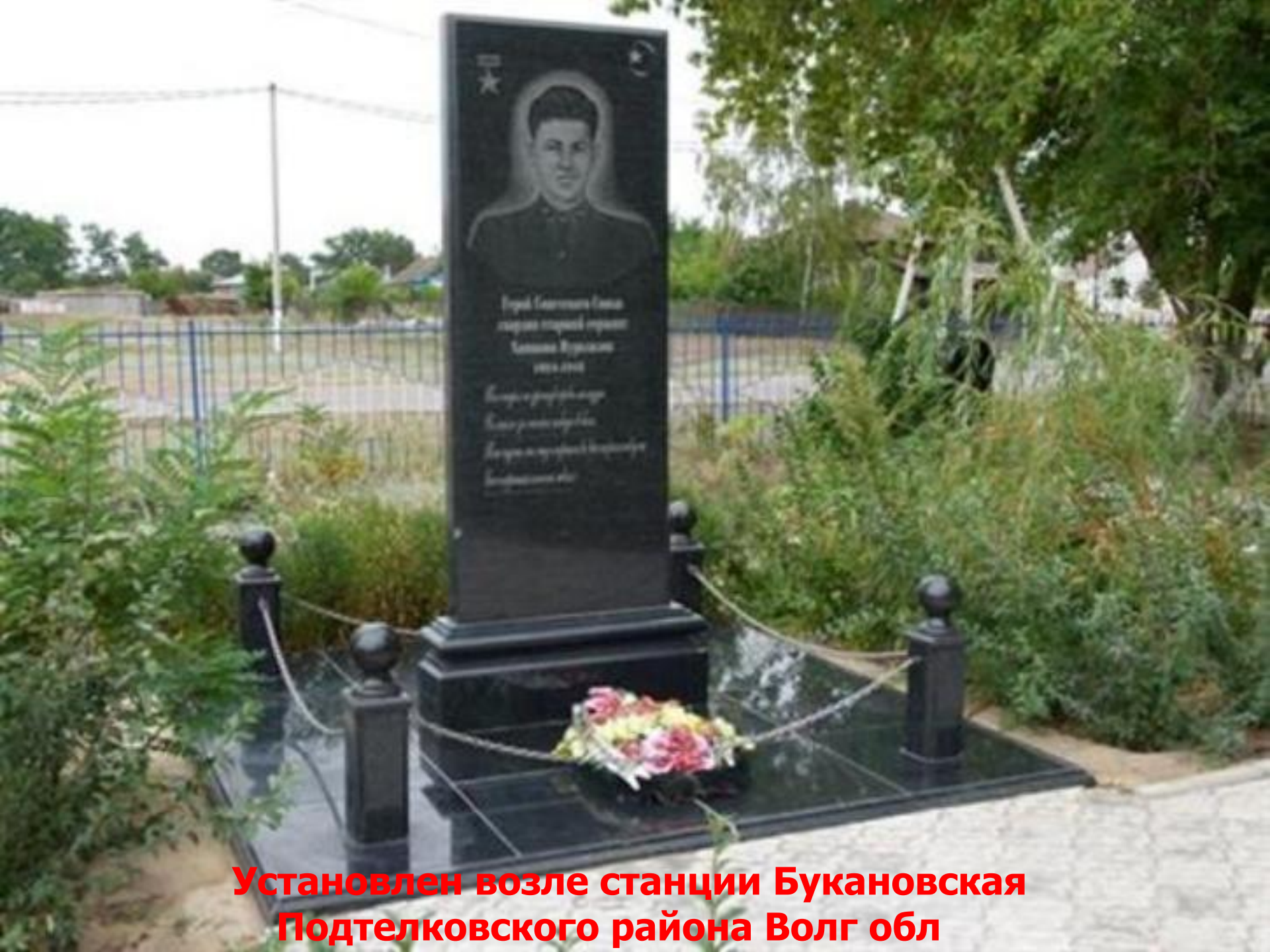
Установлен возле станции Букановская Подтелковского района Волг обл