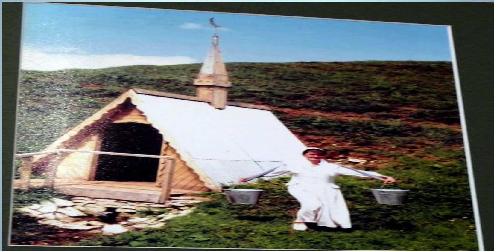
Кушлавич авылында Тукай чишмәсе. 2011 Родник Тукая в селе Кошлауч. 2011