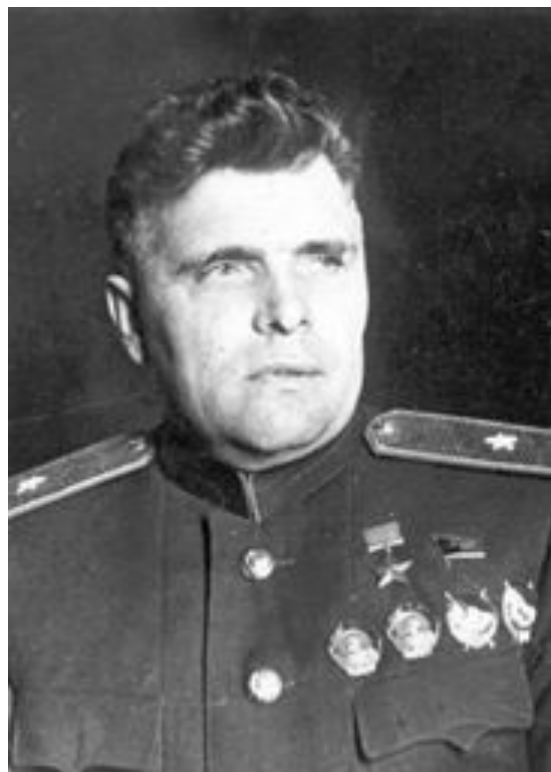
Генерал-майор Водопьянов Михаил Васильевич (1899—1980)